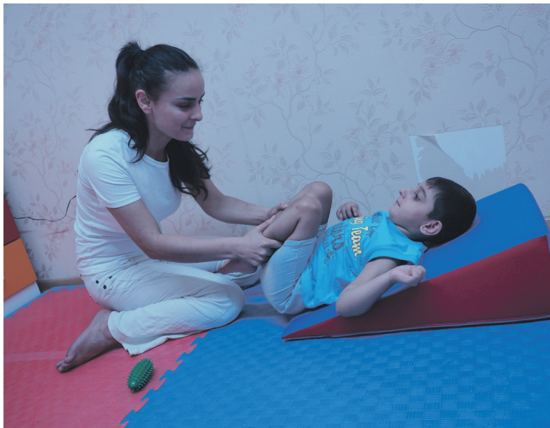
Nurane ved HRC-senteret i arbeid med eitt av borna.