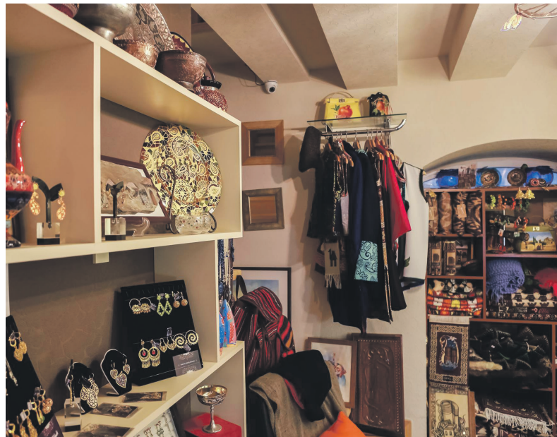
Hjelp ut av fattigdom.