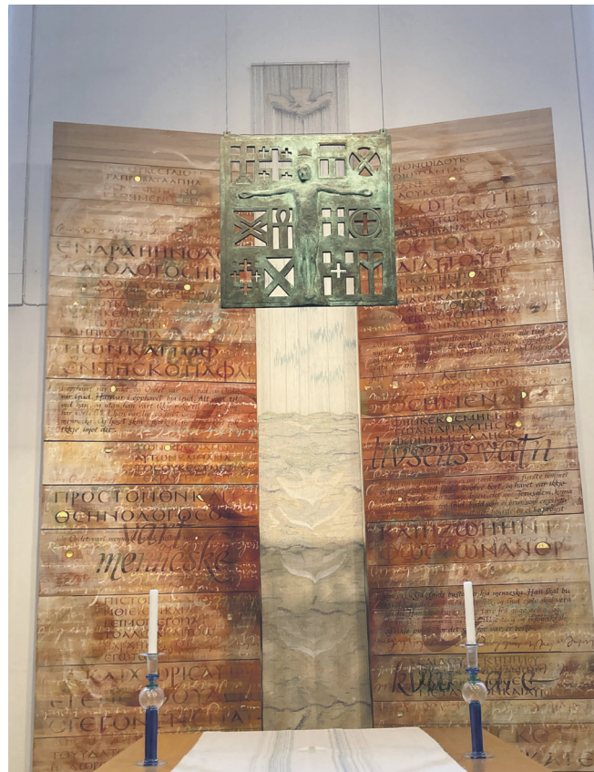
Fondveggen i Osteridet kyrkje.

(1 Kor 12,12-13) Mange kroppsdelar med ulike former og funksjonar, men likevel éin kropp – slik er kyrkja.