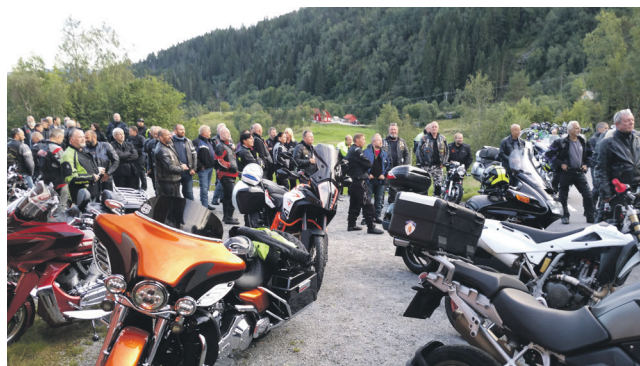
Mange MC-folk frå ulike klubbar valfartar til Holy Riders sine samlingar på Hjelmås.

– Vi er blitt kjende for ekstremt gode og sunne vaflar, seier HR-leiaren med eit smil. Klubben byr på gratis kaffi og HR-bibel (NT for MC-folk). MC-kafeen er open så lenge det ikkje er «kvite» vegar – eller korona-tiltak. Vinterstid held vi oss inne og dei fleste kjem då i bil. Men enkelte meiner ein MC-klubb er for dei på to hjul og køyrer MC.