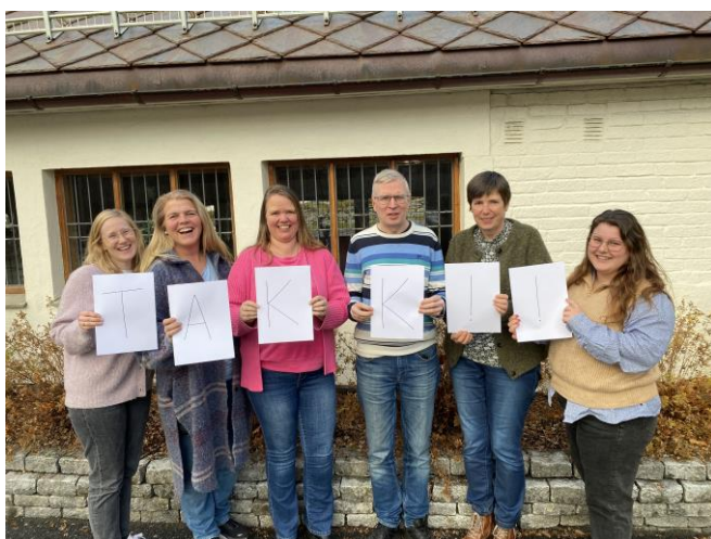
Takk frå staben på Frivillighetens dag, 5. desember :)