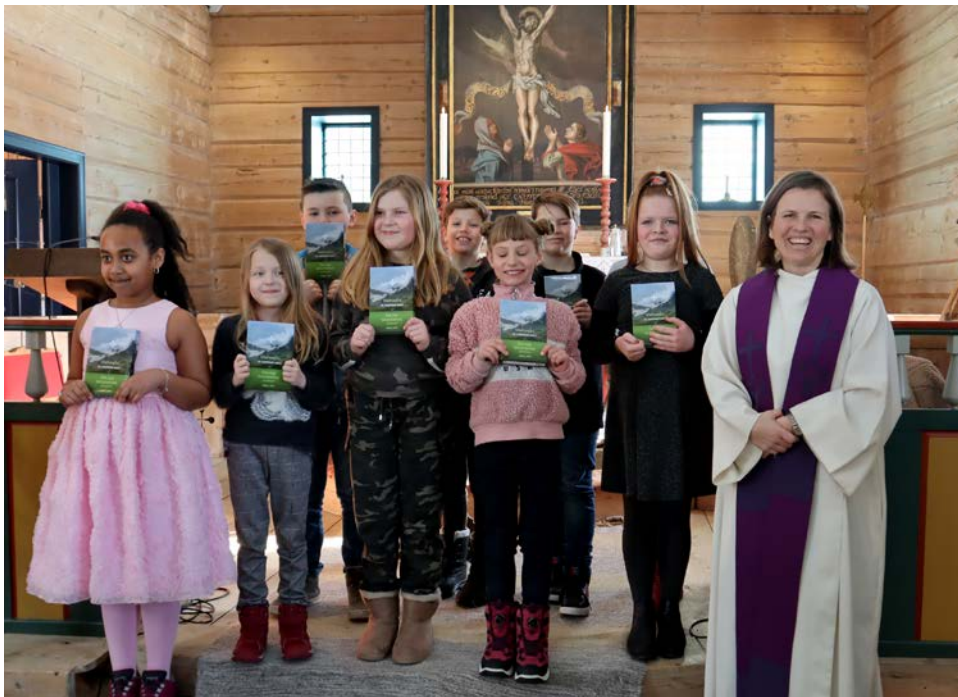
Boka «Det nye testamentet og salmane, friluftsgåve» vart delt ut til dei som var med på Kode-B samlinga.