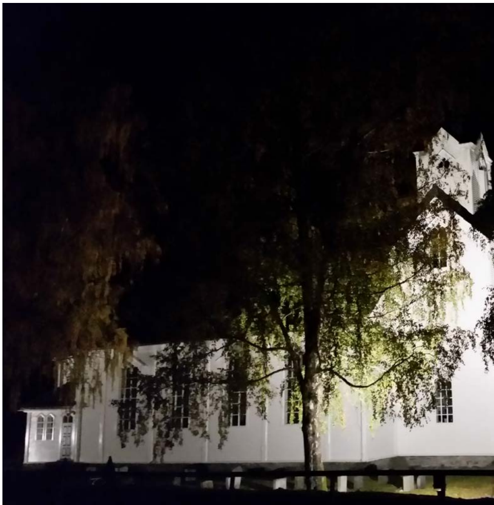
Dramaet med konfirmantkappene til Helgheim kyrkje enda godt til slutt.

Etter ei hyggeleg kaffiøkt er det tid for oppsummering før alle går kvar til sitt. Organisten og presten har vore litt usamde om songar på den stor dagen, men dei har komme fram til det dei føler er eit godt forslag. Kyrkjetenaren i Helgheim er ein av dei siste som har ordet og han vrir seg på stolen og har det ikkje heilt godt. Men så kjem det; konfirmantkappene er ikkje å finne. Han har leita heile kyrkja rundt, sjekka hos dei som skulle vaske dei om jobben er gjort, og om dei har dei liggande, men nei ingen kapper er å finne.