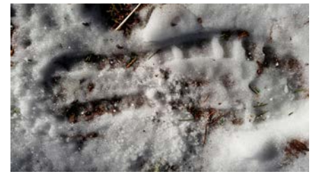
Mange spor vart sjekka, men dei viste seg stort sett å vere blindspor

Neste dag er kyrkjetenaren på plass hos Statens Vegvesen til avtalt tid. Han håpar at løysinga på mysteriet om konfirmantkappane kan ligge der, men er det truleg? Etter at kassane er komme kyrkjetenaren i hen-