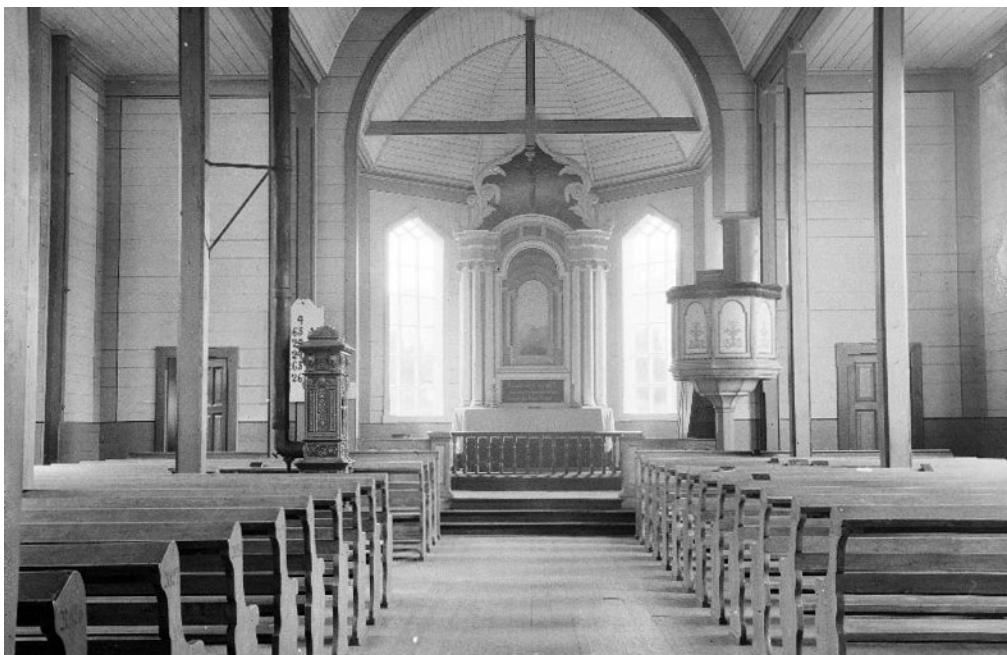
Sjolv om dei badde det vanskeleg, var kyrkja ein viktig institusjon i eldre tider. Dette fotoet syner Helgeimskyrkja slik ho var i starten, med vindauge i koret og vedomn.

Dei mangla medisin og helsestell mot sjukdom og epidemiar. Dei måtte stole på egne krefter og såg ofte kor lite dei strakk til. Når det kom uår med kulde og store mengder med nedbørså avlinga svikta, fekk dei problem med å skaffe nok mat. Dei hadde ingen butikk der dei kunne kjøpe det dei trong. Men dei merka at dei hadde Guds velsigning over arbeidet og den vinninga dei fekk av det. Difor greidde dei seg og møtte kvardagen og slitet under ein open himmel.