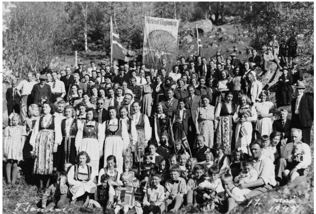
Felles 17-mai-feiring for Dvergsdal, Sunde og Myklebust i 1948. Vi ser Fana til Myklebust Ungdomslag som Nikolai Astrup måla.

Dei levde i eit utviklingsland. Eit utviklingsland som vi har lagt bak oss. Eg trur det er rett