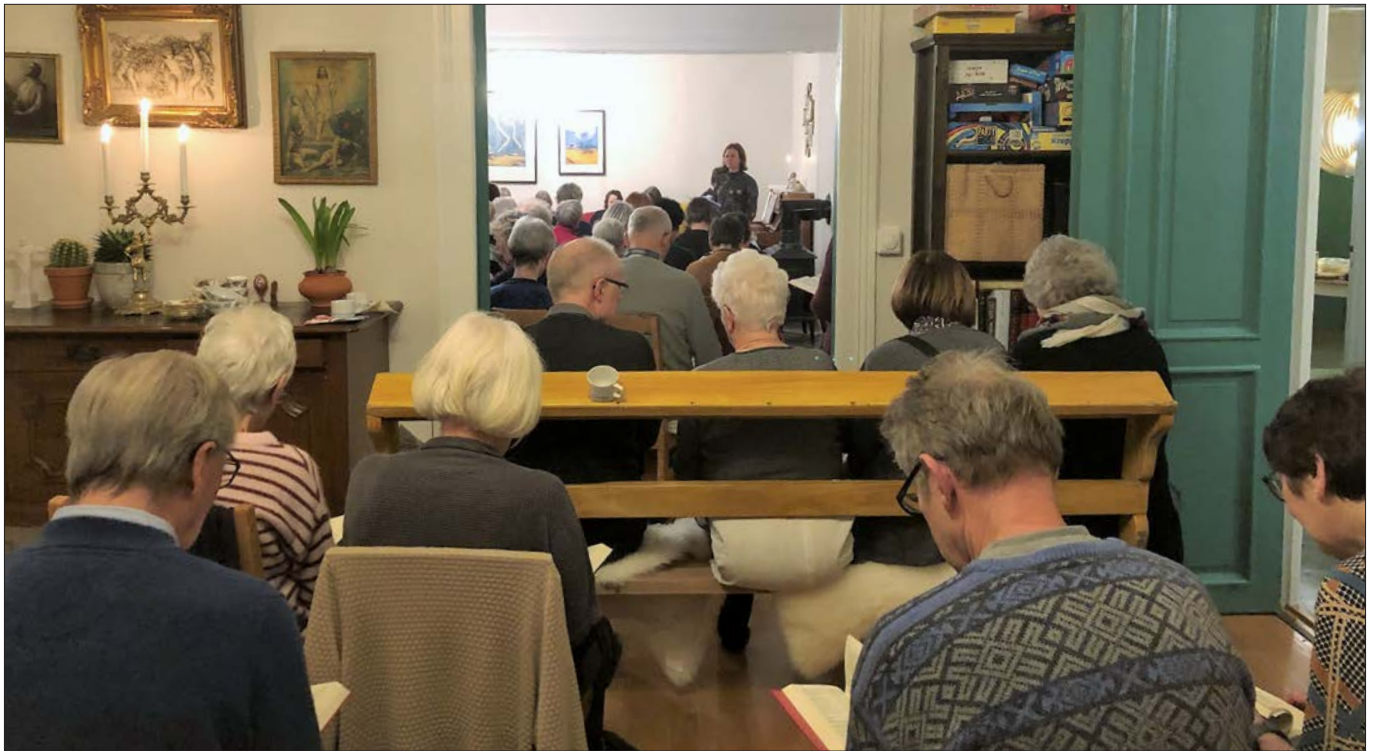
Det var fullt hus i prestegarden etter førestillinga i kyrkja.