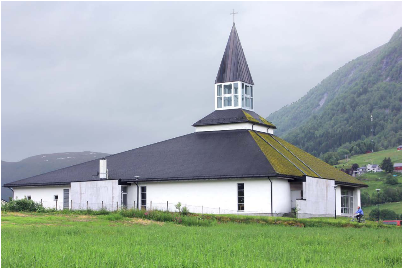
Vassenden kyrkjesenter går frå stifting til foreining.