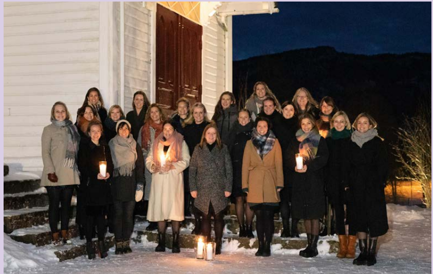
Kvinnekoret Kvitre inviterer til julekonsert i Helgheim kyrkje måndag 5. desember.

Dei fortalde borna og barneborna at dei had-