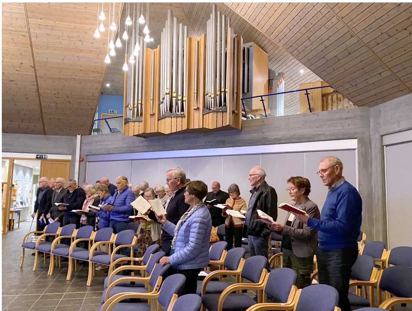
Det vart både song og musikk på mimrekvelden i samband med 20 års jubileet til Vassenden kyrkjesenter.