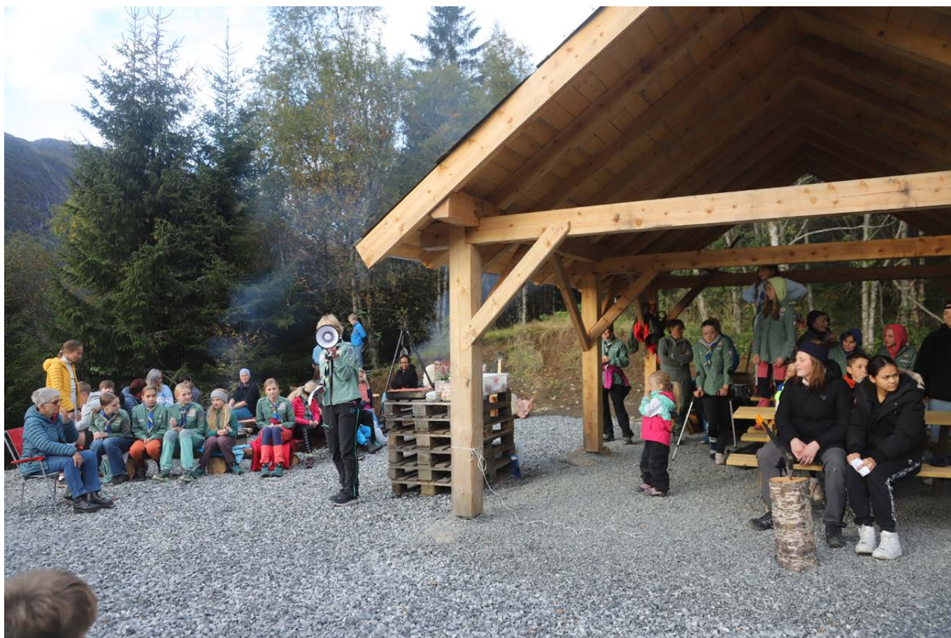
Ei stor grillhytte er eitt av to bygg som er komne på plass.