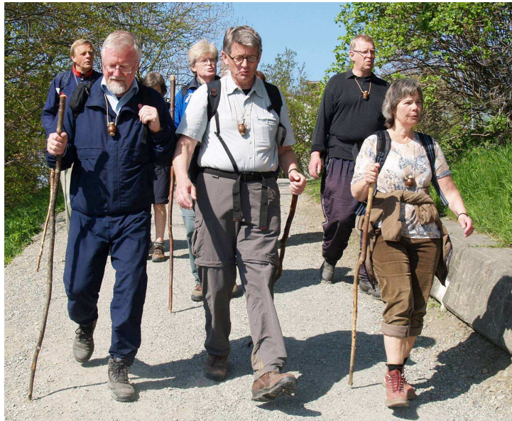
3. – 8. mai 2008 deltok biskopene på pilegrimsvandring fra Oslo mot Nidaros