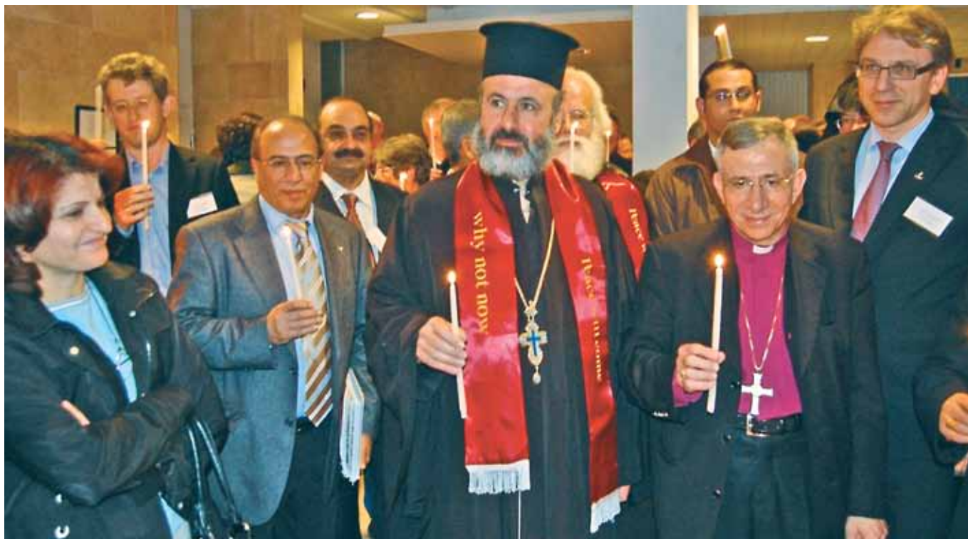
Lystening ved lanseringen av dokumentet Kairos Palestina 11. desember 2009