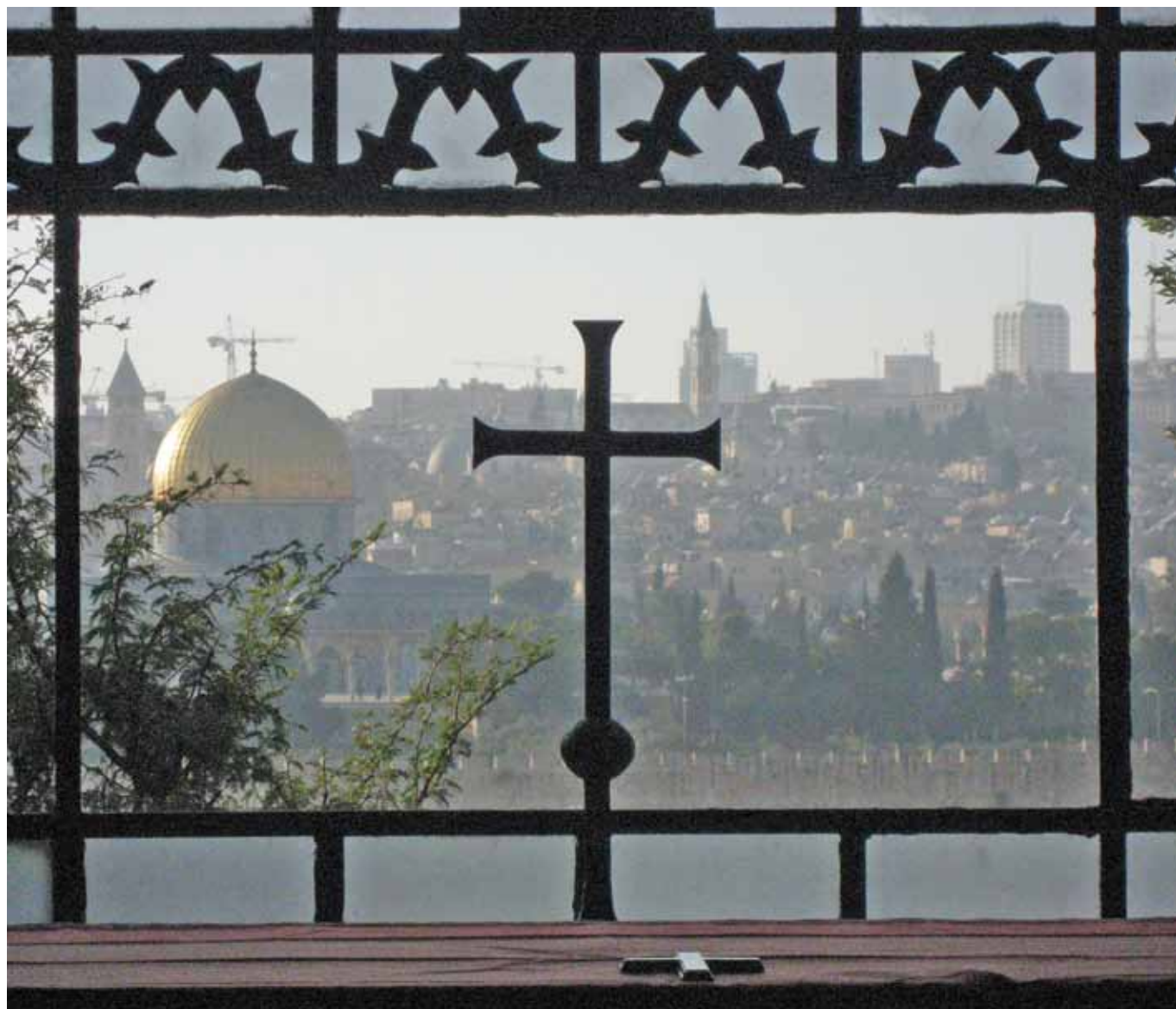
Jerusalem fra Tårekirken på Oljeberget