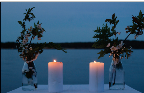
Lørdag var det bønnevandring langs stranda. Konfirmantene var innom seks poster eller seks ulike måter å be på. På en av postene var det lystenning. På en annen var det mulig å skrive ned bønnen på lapper. Det var også en stasjon utstyrt med en bålpanne for å symbolisere tilgivelse. Det en ønsket tilgivelse for, ble skrevet ned på en lapp. Så ble lappen kastet på bålpanna, der den brant opp. En stasjon var bygd opp av steiner som danner et kors. Steinene symboliserte det som tynget i livet som en kunne legge fra seg. Bønnevandringen ble avsluttet med nattverd.