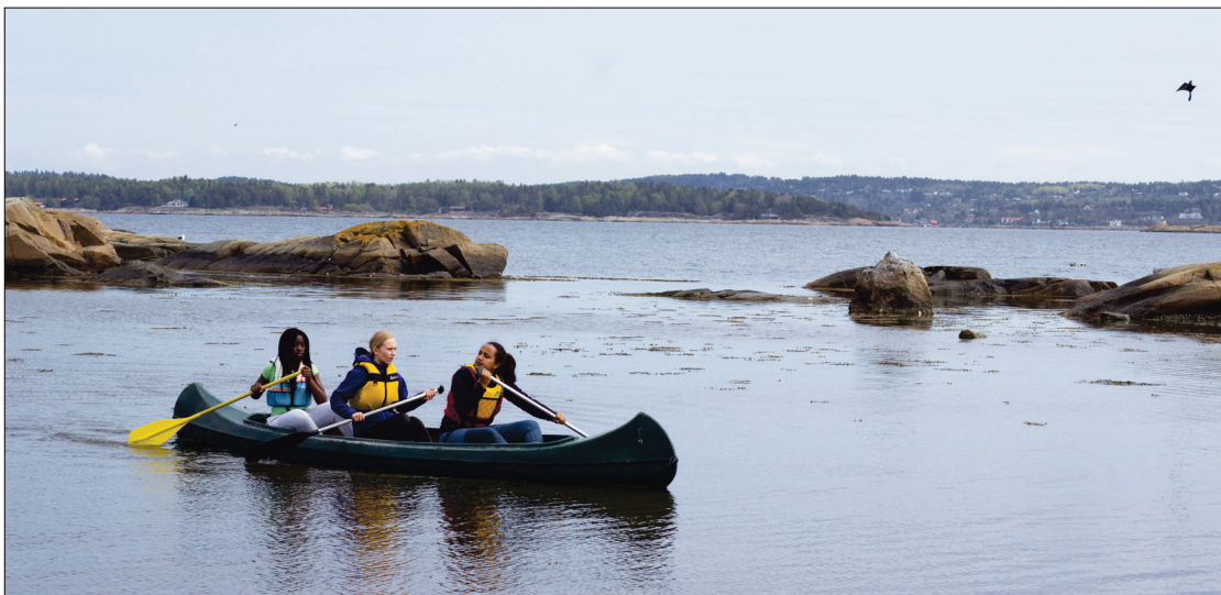
Knattholmen leirsted ligger på en holme utenfor Sandefjord. Leirstedet har egne kanoer, som ble flittig brukt.