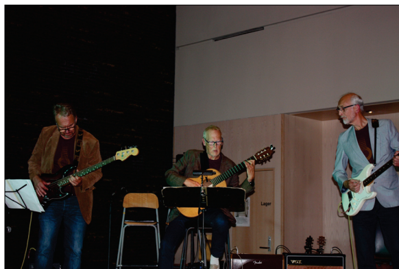
Kulturscenen i konfirmantsalen var flittig i bruk under fjorårets kulturturkveld. Det var både solistinnslag og band med lokale utøvere.