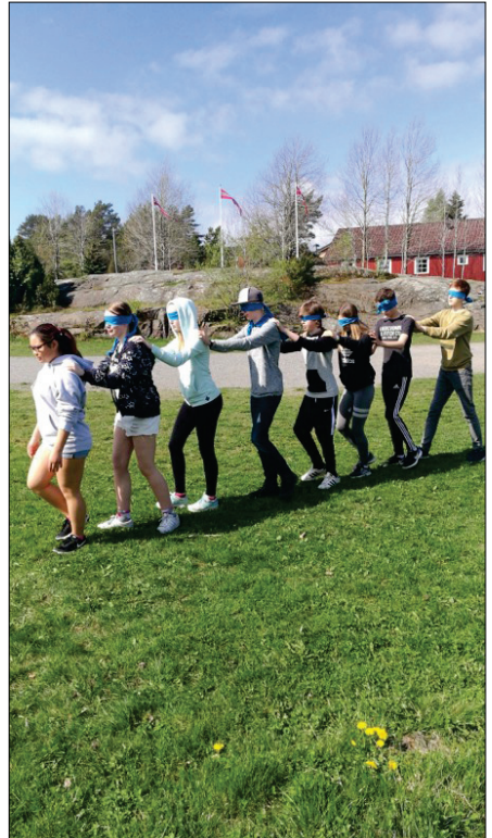
Her er et bilde fra påskevandringen. Konfirmantene gikk gjennom påskefortellingen med bind for øynene. Dette gjorde de for å prøve å skjerpe de andre sansene. Det å ikke kunne bruke synet gav en litt annen opplevelse av påskedramaet.