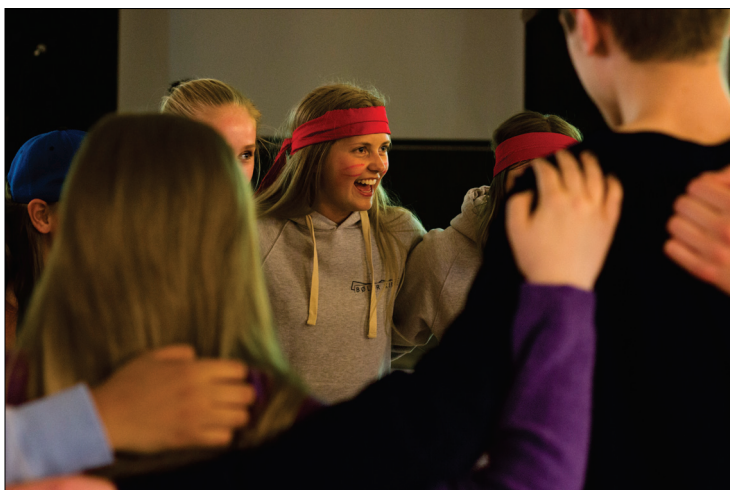
Mye av første kvelden ble brukt til teambuilding. Konfirmanter og ledere ble delt inn i tre lag, et rødt, et svart og et gult. Så var det ulike konkurranser der lagene skulle konkurrere mot hverandre. For å vinne var det viktig at laget jobbet godt sammen. Foto: Maria Saxegaard

Bildene gir et glimt av noe av det konfirmantene fikk oppleve på Knattholmen.