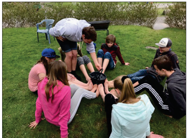
Bildet er fra et samarbeidsløp. Det var bare når laget samarbeidet at oppgavene kunne bli løst. På bildet er det en bøtte med vann som skal løftes. Det eneste konfirmantene hadde lov til å bruke var beina. Det var først når alle hjalp til at oppgaven ble løst uten at vannet rant ut.