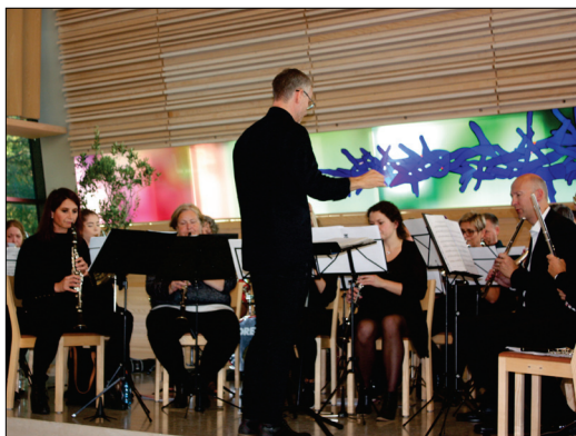
Fra fjorårets konsert med Bøler og Ila janitsjar. Flere hundre mennesker var til stede på konsertene i kirkerommet.

Under hele arrangementer vil det bli åpen kafé i regi av Østensjø barne- og ungdomsteater.