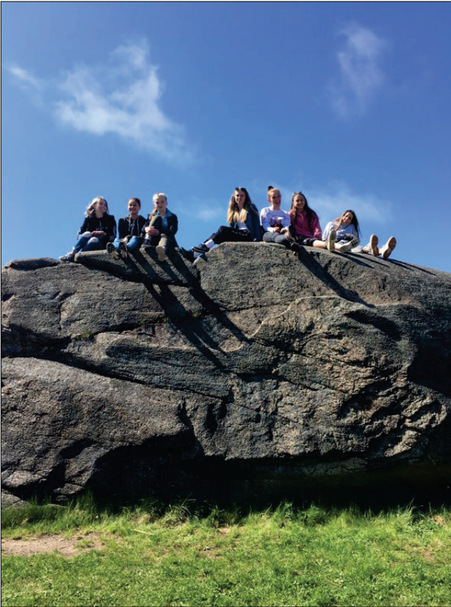
Det å være på leir er også litt fritid. Fjellet ble fort et samlingssted for konfirmantene. Under gudstjenesten på søndag var det for øvrig det samme fjellet som ble brukt som altertavle.