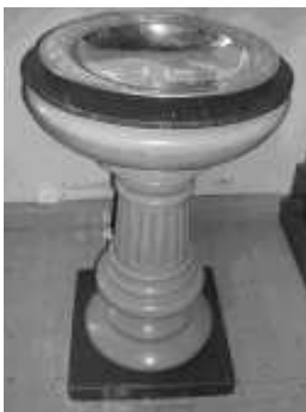
Døpefonten i Heggen.

unnelig på en kamerat av meg som fikk lov til å være ute så lenge han ville, mens jeg ble ropt inn midt i aktiviteten som vi hadde det så gøy med. I ettertid har jeg skjönt at kameraten min hadde det ikke så greit. Foreldrene brydde seg ikke så mye. Grenseløsheten var ikke så morsomt for ham som jeg først trodde.