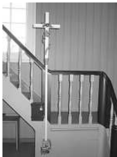
Korset i Nykirke.