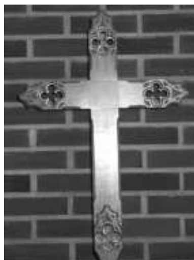
Korset i Snarum.