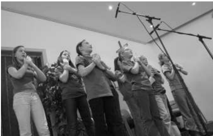
Modum Soul Children.