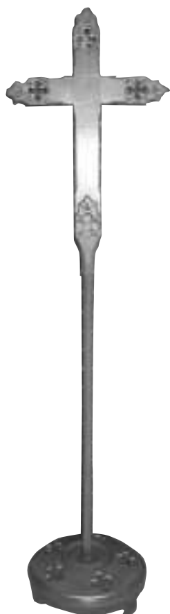
Korset i Snarum.