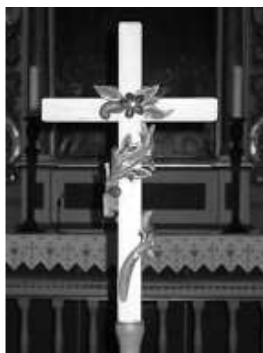
Korset i Nykirke.