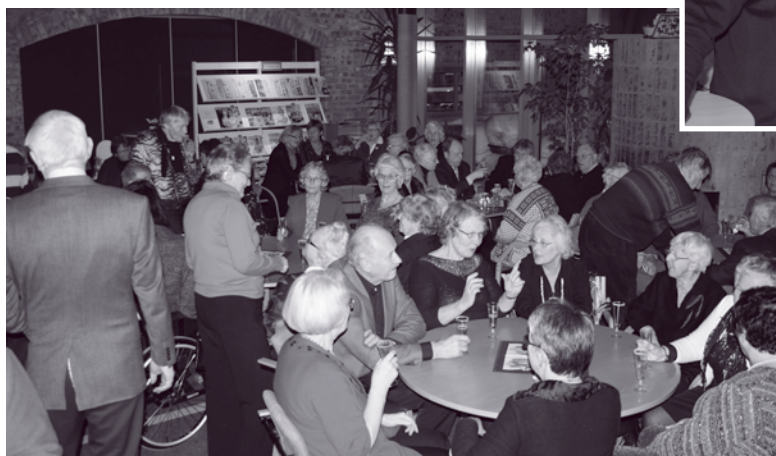
Aktivitet på kirketorget.