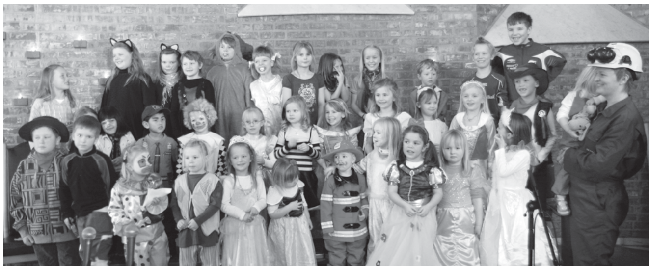
Karneval i Åmot kirke ved Åmot barnegospel.