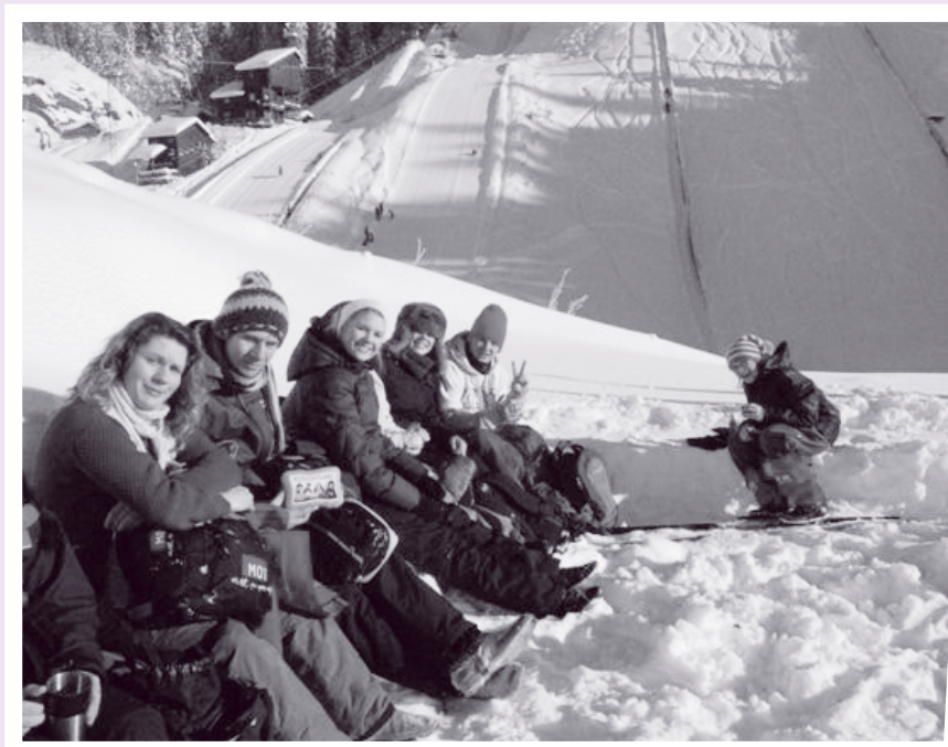
Skidag i Vikersund hoppcenter.