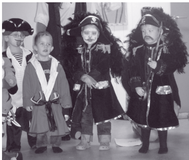
Rundt fastelavn befolkes Melumenga barnehage av prinsesser, tiger-gutter, sabeltanner og riddere i barnestørrelse.