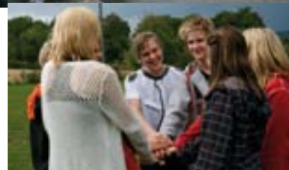
Frihet, likhet og brorskap.