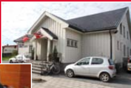
Vikersund menighetscenter 30 år