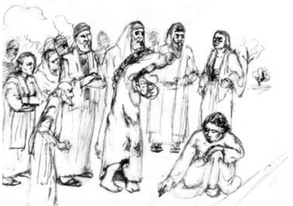
Illustrasjon av Jesus og kvinnen som ble grepet i hor.

I Oberammergau kom de med en kvinne til Jesus, hun var grepet på fersk gjerning i ekteskapsbrudd – «I loven står