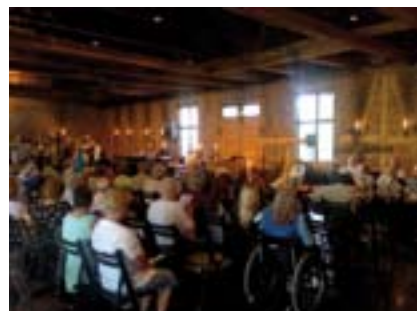
En fullsatt Glasshytte under gudstjenesten 15. august.