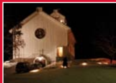
Juledagsmorgen i Nykirke

Job 19, 25: Men jeg vet at min gjenløser lever; og som den siste skal han stå fram på jorden.