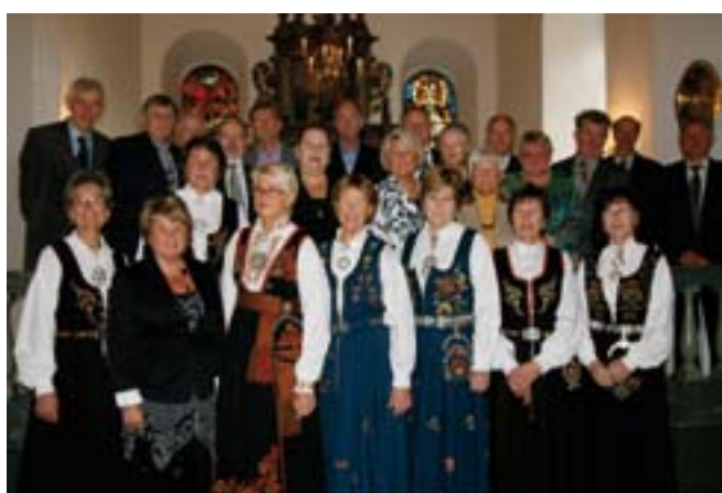
Gullkonfirmanter i Heggen 2010.