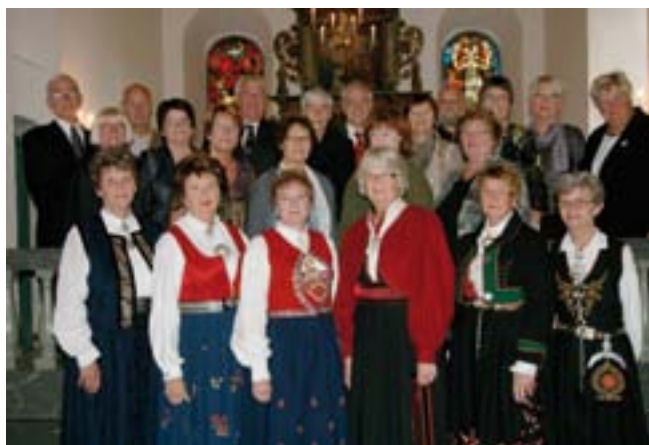
Gullkonfirmanter i Heggen 2010.