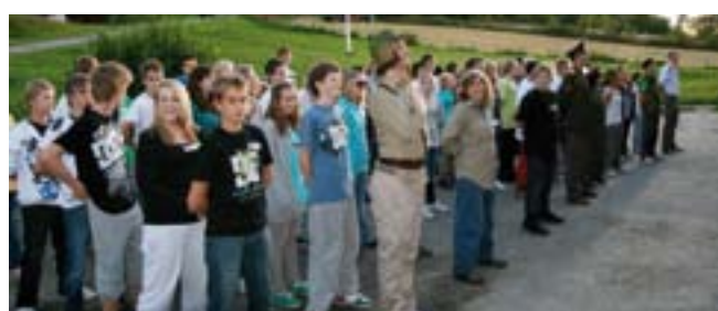
Kompaniet er samlet under konfirmantleiren på Gulsrud.