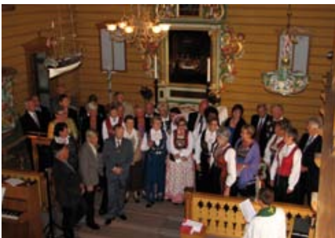
Gullkonfirmanter i Nykirke 2010.