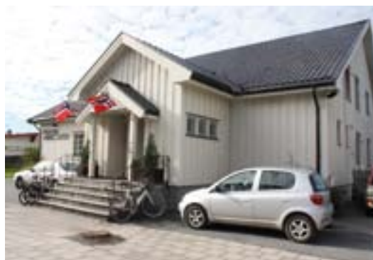
Menighetscenteret har blitt litt av et kjennemerke i Vikersundgata. Søndag 26.09. ble 30-årsjubileet markert.