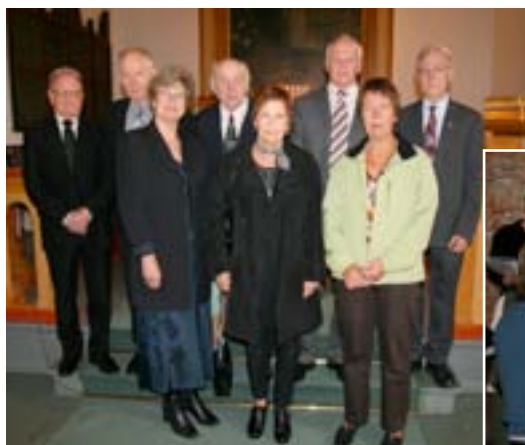
Gullkonfirmanter i Snarum 2010.