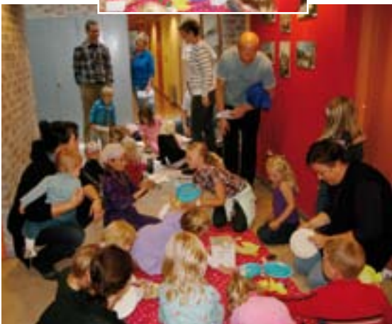
Aktivitetsgruppa i Åmot barnespel.