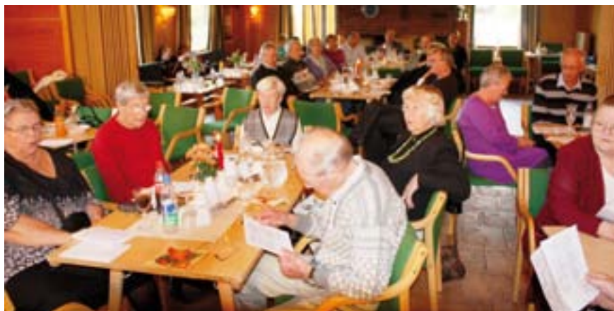
Rundt 80 mennesker var søndag samlet på Vikersund menighetscenter for å feire senterets 30-årsjubileum den 26. september.