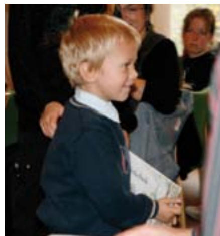
Utdeling av «4-års Kirkebok» på Vikersund menighetscenter, 10. oktober.