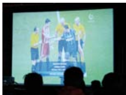
Champions League-fest i Åmot kirke!