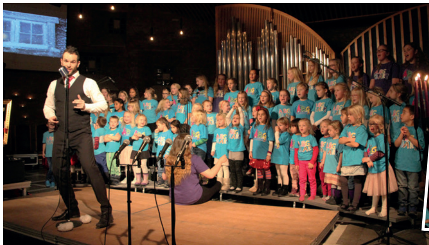
Adventskonsert med Åmot barnespel