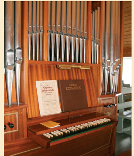
Orgelet fra 1994