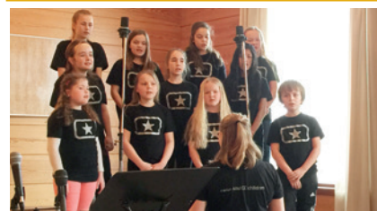
Modum Soul Children synger på familiegudstjenesten 29.1.