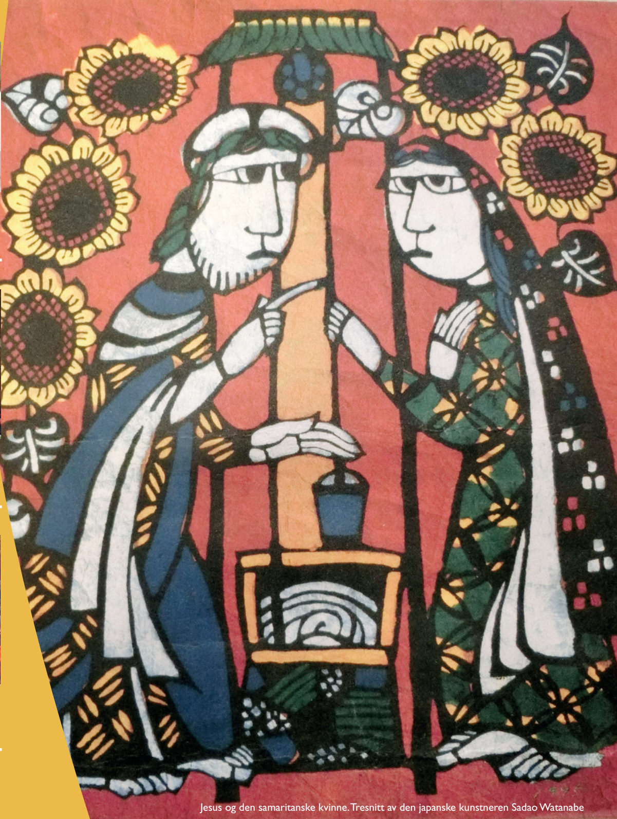
Jesus og den samaritanske kvinne. Tresnitt av den japanske kunstneren Sadao Watanabe