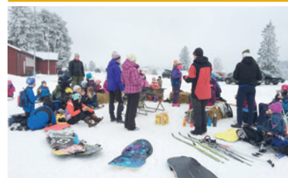
Bålkos på Simostranda