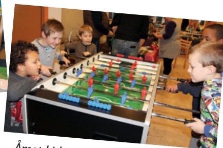
Åmot kirke har fått nytt fotballspill! En fin juleverkstedaktivitet