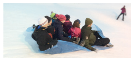
Små og store familiespeidere på full fart ned bakken på Simostranda