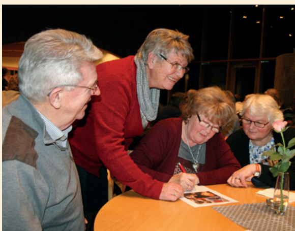
Stort engasjement. Det er quiz!