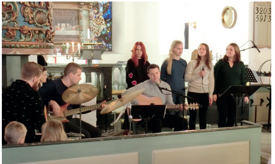
Barn og svigerbarn gledet oss med fin sang

hun hadde sunget for ham i telefonen. Det ble en gudstjeneste der vi fikk uttrykke takk til Tormod for alt det gode han gjennom sin prestedtjeneste har gitt oss og med varme ønsker om at han skal få en rik tjeneste i Krødsherad.