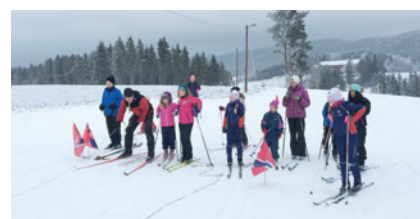
Instruksjon i livlinekasting før stafett! På Simostranda kjører familiespeideren alternativ skyting; livlinekasting på mål!