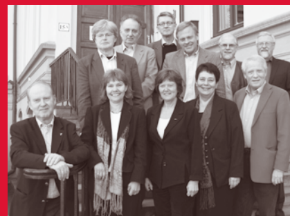
Bilde fra bispemøtet i mars 2007.

Gud, vår Skaper, gav oss en vakker jord til klok forvaltning, ikke til uvettig rovdrift.