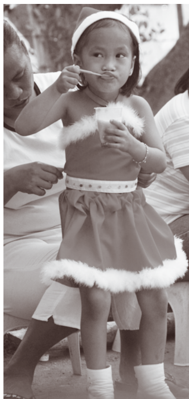
Fra julefest på Salamba. Bilde til v.: Barn står i kø for å få årets julegave. Bilde til h.: En nissejente er ferdig med dansen og nyter desserten.