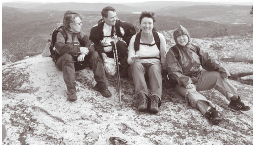
Noen fra Fjellsportgruppen i Tro og Lys på Andersnatten en august-dag.