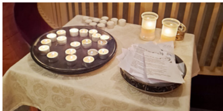
Bønnelappar og tente lys for Ukraina

Det er vanskeleg å svare på korleis folk opplever kyrkja, om ho blir opplevd relevant. Men for meg som av og til står med ansiktet vendt mot ganske mange menneske, kjennest det som ho angår og har noko meningsfylt å gje folk. Enno sit varmen i meg frå Volbu kyrkje då ukrainske songar blanda seg med orgeltonar, salmesong og langeleik. Då ukrainarar og lokale bygdefolk saman tente lys og skreiv bønner om fred på eittårsdagen for Russlands angrep på Ukraina, då kjendest kyrkja absolutt relevant!