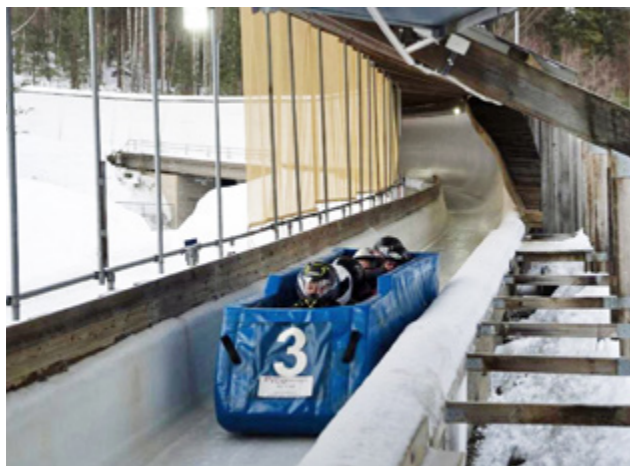
Bobkjøring fall verkeleg i smak.