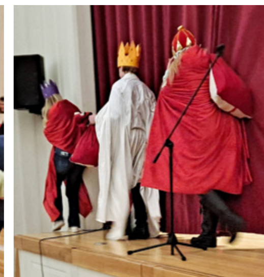
Tradisjonen tru kjem dei tre vise menn med gåver til alle.