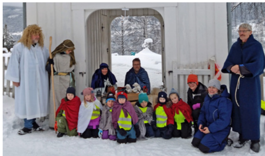
Julevandring 2022

Tradisjonen tru kom dei eldste ungene i Rogne barnehage og var med på julevandring ved Rogne kyrkje. Takk til staben og dei tilsette i barnehagen som stiller som skodepelarar!