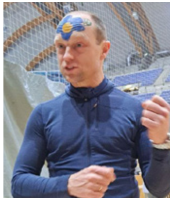
På Ugandamarkedet til inntekt for bistandsarbeid i Uganda kunne ein få kjøpt det meste f.eks. ekstra ansiktspryd.

Etter to år med Korona og avlyste leirar var det flott å kunne kome på leir igjen. Bare vellæte frå fornøgde konfirmantar, foreldre og prest. (Vi hadde med oss dei greiaste konfirmantane). Nokre minne kjem her!