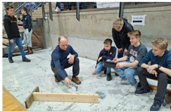
Gutta våre hadde konkurranse om slagferdighet på Ugandamarkedet.