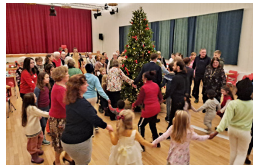
Gang rundt juletreet

Kvelden vart avslutta med takk og "Deilig er jorden".