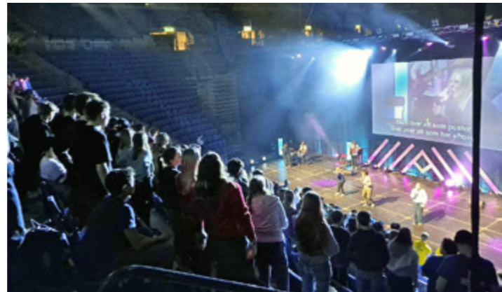
Flotte undervisningsshow morgon og kveld.