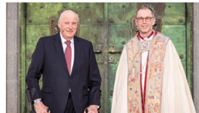
Saman med kongen

Han ønsker også at kyrkja skal bidra til håp i ei verd prega av krig. – Eg trur kyrkja betyr mye for folk, og det er mange utfordringar vi slit med både på det personlege plan, men også i verda i dag. Da treng vi ein stad å ta vare på draumane våre om håp, om at det umoglege kanskje kan skje, at vi saman arbeider for både håp og kjærleik, seier han.