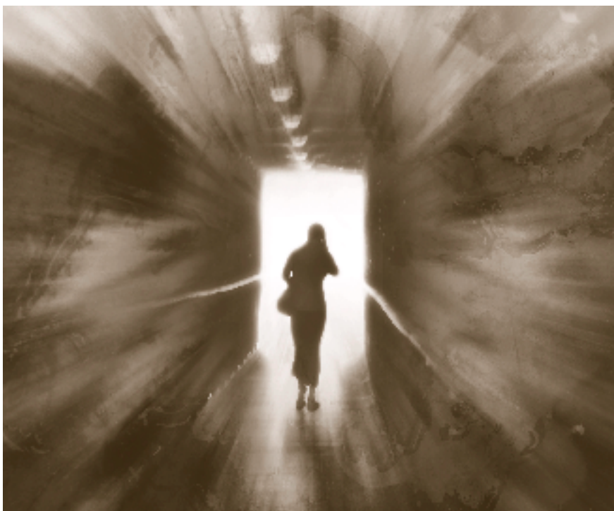
«En spasertur gjennom historien».