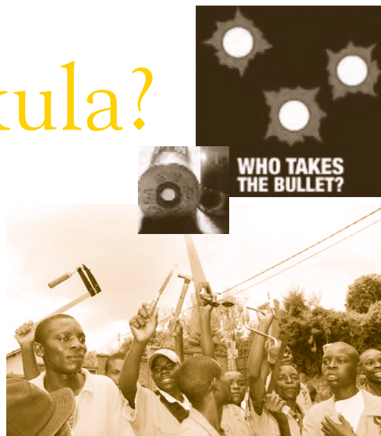
Fra våpen til hammer og sag.

Skal Norge være en fredsnasjon, må vi få orden på dette! Ønsker du å støtte kampanjen?