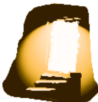
sto opp fra de døde