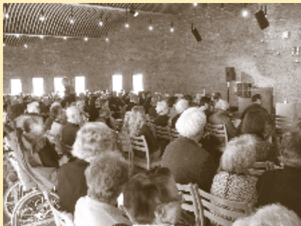
En fullsatt Åmot kirke venter spent.