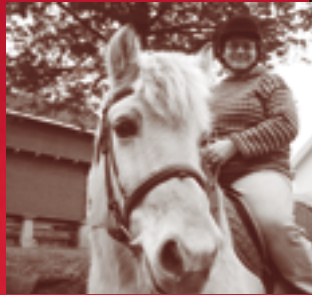
Prest til hest side 3