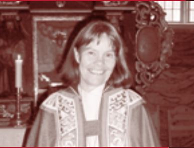
Bispevisitas side 6