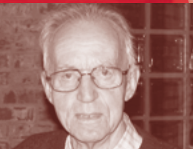
Menighetsprofilen side 12