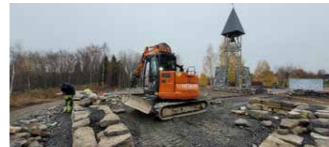
Grunnarbeidet er godt i gang.

Den nyåpnede minnelunden står som et symbol på samhold, samarbeid og dedikasjon, og den vil tjene som et verdig sted for å minnes våre kjære som har gått bort.