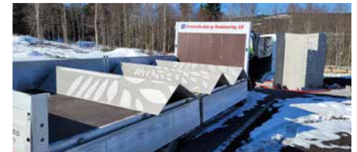
Det nærmer seg ferdigstillelse.