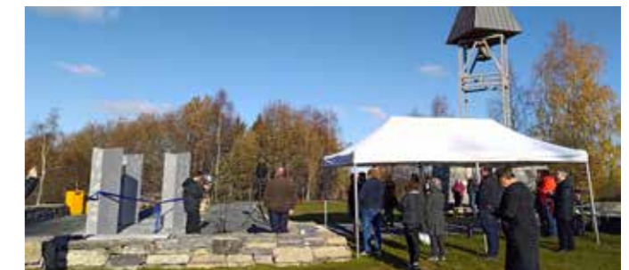
Mange fram møtte ved snorklipping og offisiell åpning av minnelunden på Bakkerud.