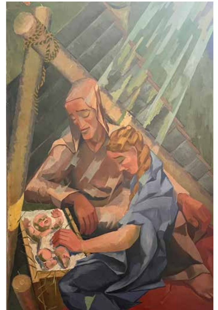
Fra korveggen i Kapp kirke. Korveggen med motivet fra jesu fødsel er malt av Henry Vik i 1940.