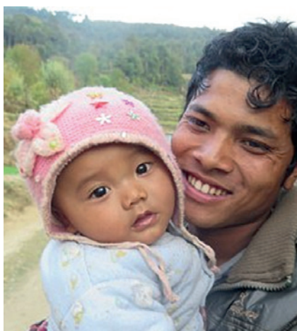
Drømmen kan bli virkelig

Vi hadde kjørt i et par dager innover i Tamakoshidalen. Her skal det potensielt kunne bygges 13 kraftverk. Det var det samme over alt, storparten av husene lå i ruiner. Folk bodde i provisoriske blikkskur og prøvde å komme i gang igjen etter jordskjelvkatastrofen.