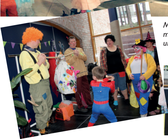
Mange flotte kostymer og mye moro i Åmot kirke under årets karneval