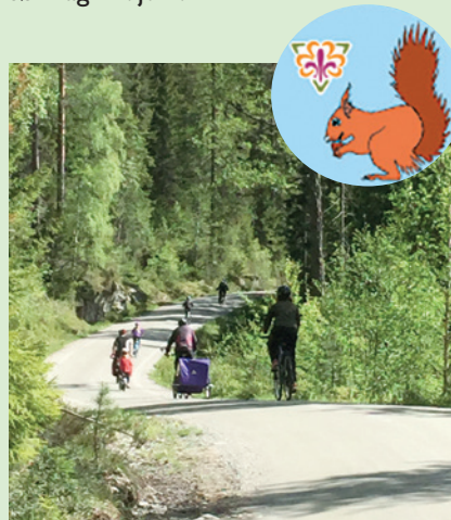
Familiespeidern sykler til gudstjeneste på Gruvetråkka

For dem som ønsker det, legges det opp til muligheten å avslutte turen slik at man kan delta på Åmot kirke sin 20 års markering og festgudstjeneste søndag 12. juni.