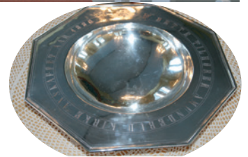
Dåpsfatet med Amundrud kirke inngravert