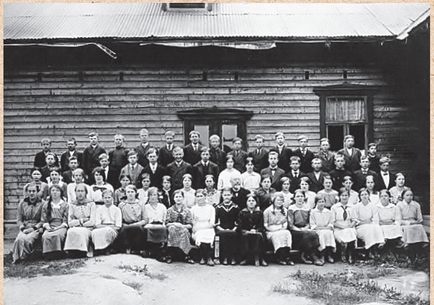
Konfirmasjon Nykirke 1913