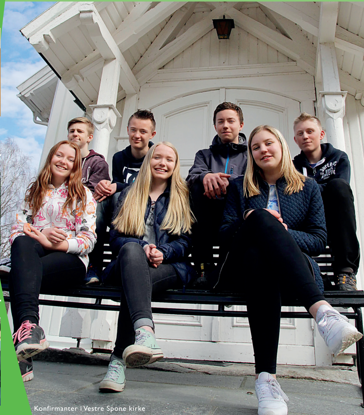
Konfirmanter i Vestre Spone kirke

La meg for alltid være ditt barn. O Herre Gud! Og hjelp meg du å bære i hjertet dine bud! Du selv meg veien vise, lær du meg trofasthet! Deg, Herre, vil jeg prise i tid og evighet!