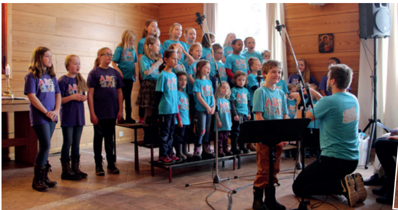
På familiegudstjenesten i mars var det flott sang av Åmot barnespel, og vi hørte om da Maria fikk besøk av en engel som sa hun skulle bli mor til Jesus