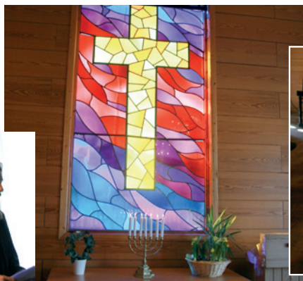
Stemningsfull påskevandring for skoleelever på menighetssenteret