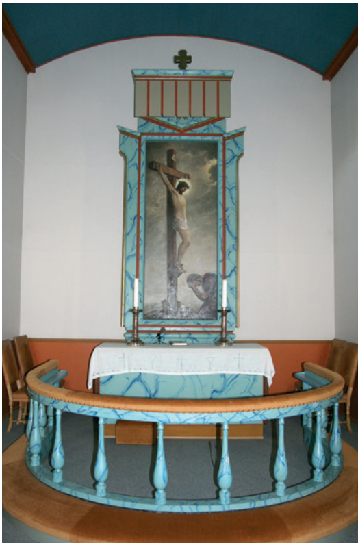
Altartavlen framstiller en knelende mann ved foten av Kristus på korset.

Tekst: Jon Mamen