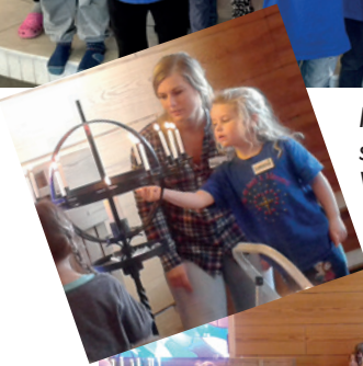
Førsteklassinger på samling i Åmot og Vikersund i februar