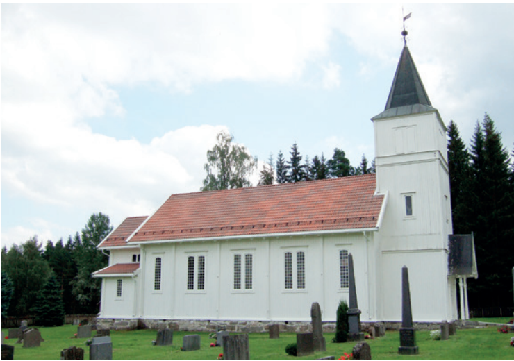
Vestre Spone kirke