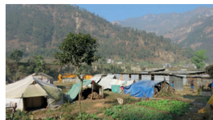
Provisoriske blikkskur i Tamakoshidalen etter jordskjelvkatastrofen