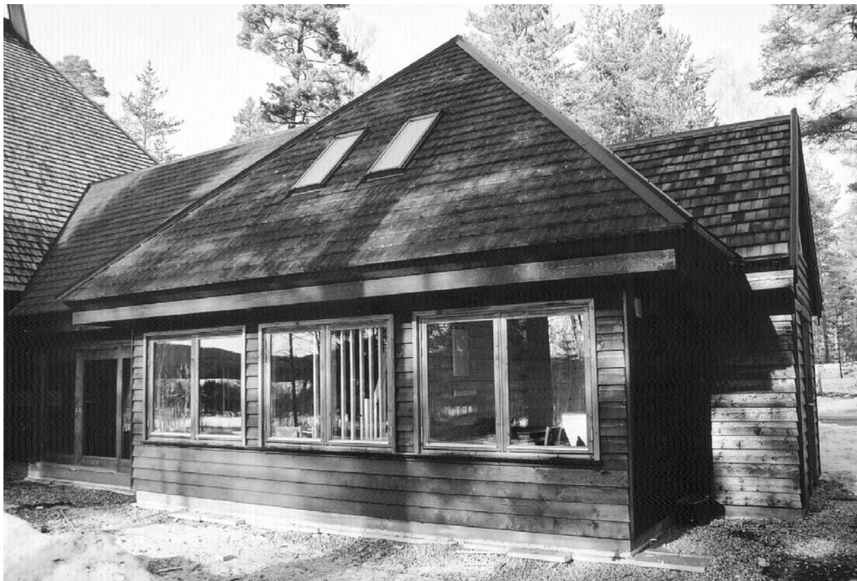
Tilbygget har blitt en naturlig del av Olavskirkens særegne arkitektur.

9. juni 1976 åpnet Olavskirken dørene. 27 år etter åpnet toalettene. Det er lenge å holde seg.