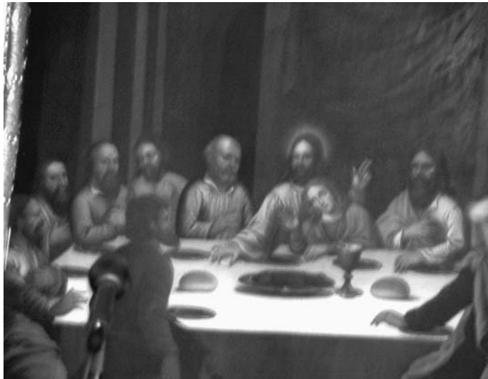
Altertafle fra Nykirke.

Over det store nattverdbildet er det et mindre bilde av korsfestelsen, og øverst står den oppstandne