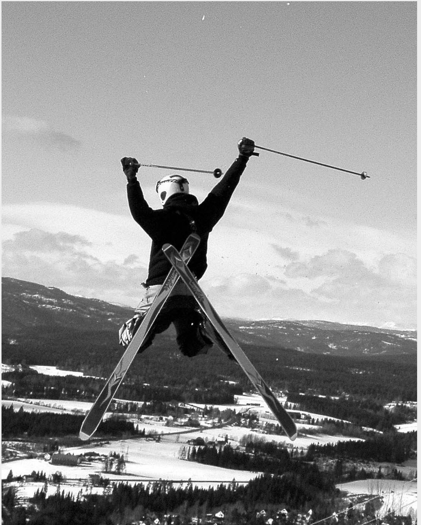
Foto: Ski or Die-festivalen 2002.