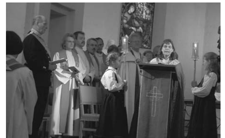
Det ble skrevet historie i Tønsberg domkirke da den femte biskop i rekken ble vigslet.