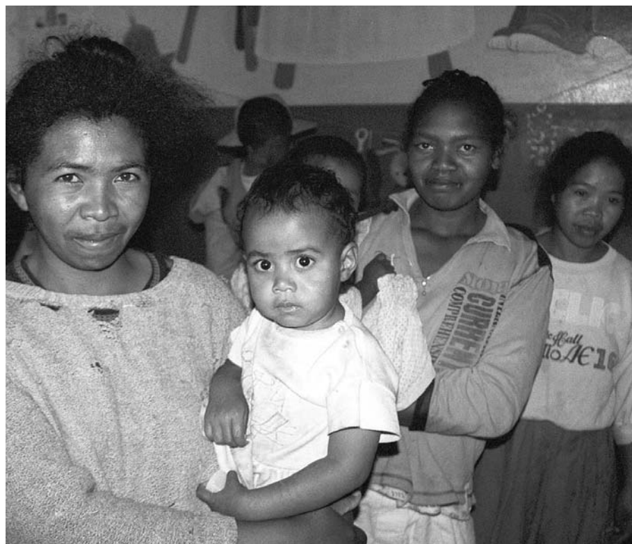
«Fangebarn1». Dette bildet ble tatt under besøket i det gassiske fengsel i år 2000. Barna må være i fengsel med mor som stjal for å overleve.