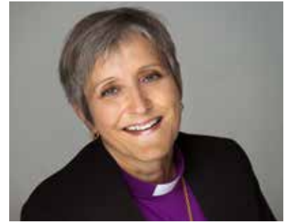
Herborg Finnset er biskop i Nidaros bispedømme.