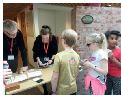
I kø for å få agentbevis