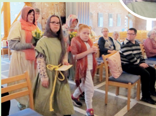
Kvinnene kommer til graven.