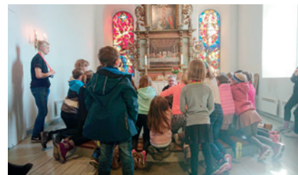
Tårnagenter ved alteret