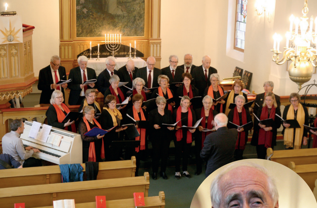
Sysle blandede kor — 110 år