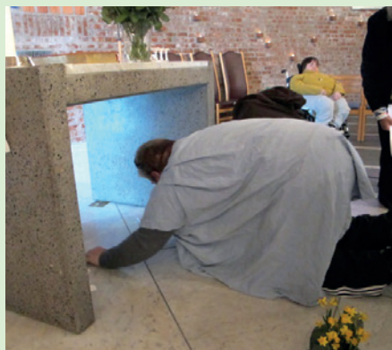
Peter ser etter Jesus inni graven.