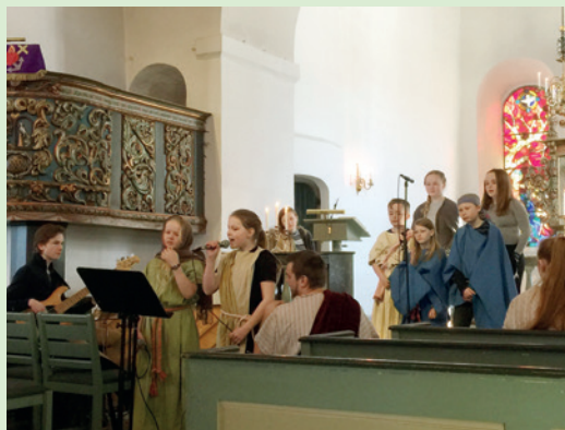
Soul Children deltok under gudstjenesten.

Han lever, Han lever, Han lever. Jesus har stått opp igjen. Han er ikke lenger i graven, nå har jeg møtt Frelseren. Han lever, og jeg skal få lov til å gå med beskjed om at Jesus Han lever fremdeles i dag, det er ingen tvil om det.