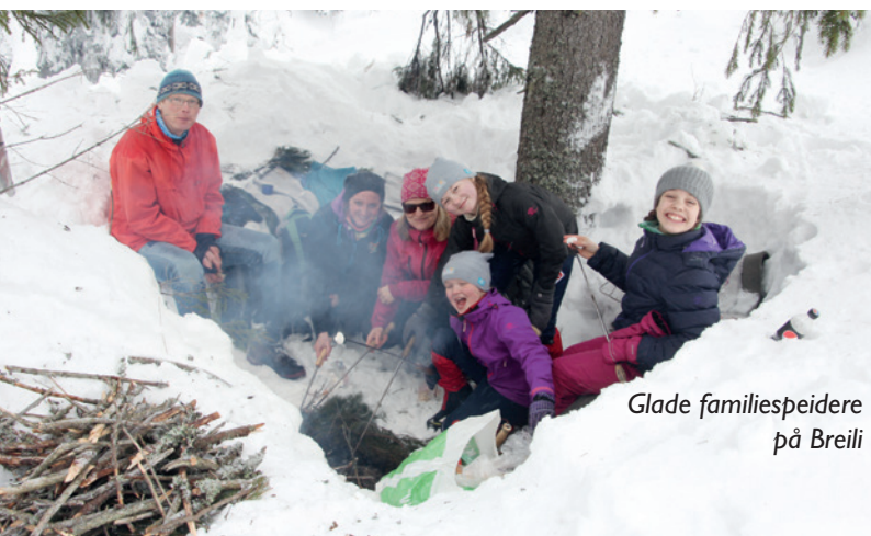
Glade familiespeidere på Breili