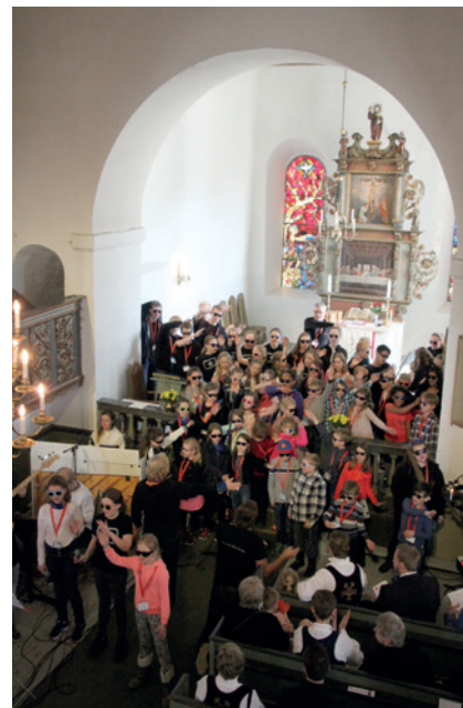
Trangt om plassen i koret i Heggen kirke