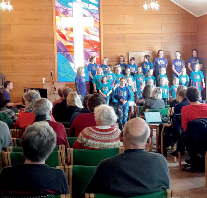
Over 100 mennesker deltok på gudstjenesten 11. mars.