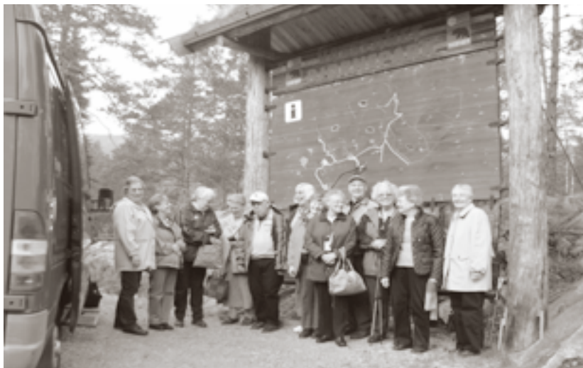
Alle deltakerne på turen.