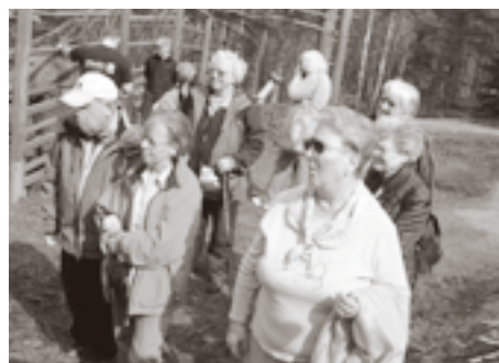
Vi skuer bamsen på avstand.