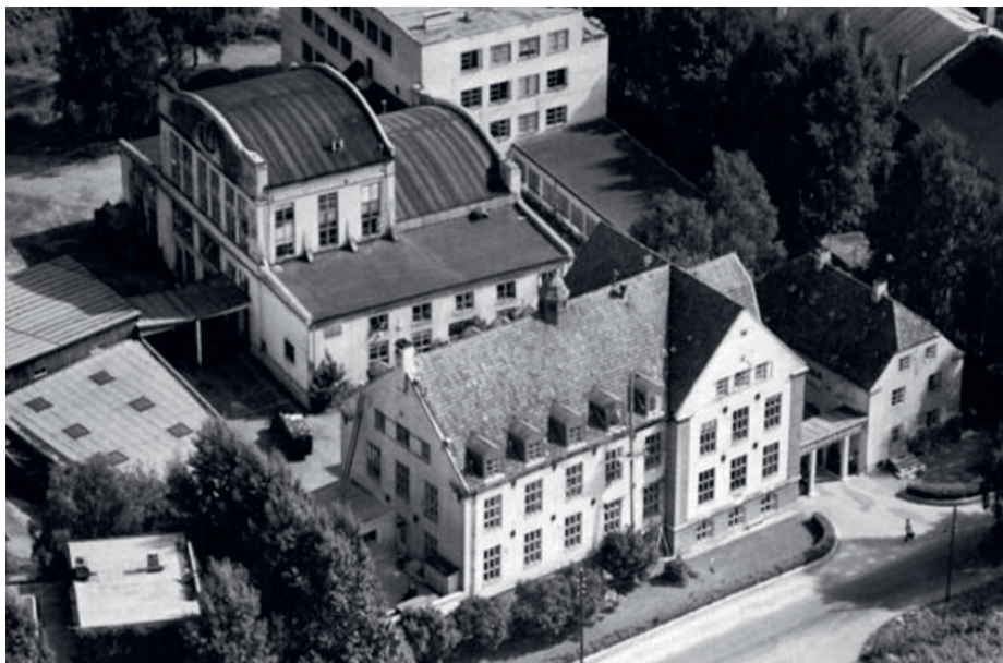
Flyfoto fra 1951 da Papirindustriens forskningsinstitutt og Norsk Dampkjelforening holdt til i Hoffsveien, og A/S Papirprodukter i forsøksstasjonen bak.

Norsk Hydro har vært et av Norges største og mest kjente industriselskaper fra starten i 1905. Fortellingen om hvordan professoren Birkeland og ingeniøren og fossespekulanten Eyde forente vitenskap og gründerånd og skapte ny teknologi og et stort industrieventyr er blant våre store nasjonale fortellinger. Mindre kjent er det kanskje at deler av eventyret utspant seg på Skøyen!