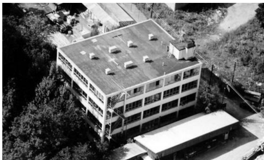
Fabrikken i 1950.