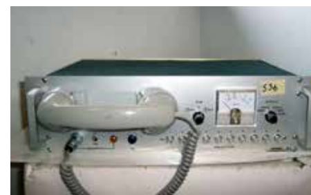
Radiotelefon produsert av Lehmkuhl på Skøyen

Det meste dreide seg om telekommunikasjon, hvor blant annet nødsamband og tidlige mobiltelefoner ga solid vekst. Lehmkuhl hadde også spesialisert seg på krypteringssystemer, og samarbeidet med Elektrisk Bureau om leveranser til forsvarsindustrien.