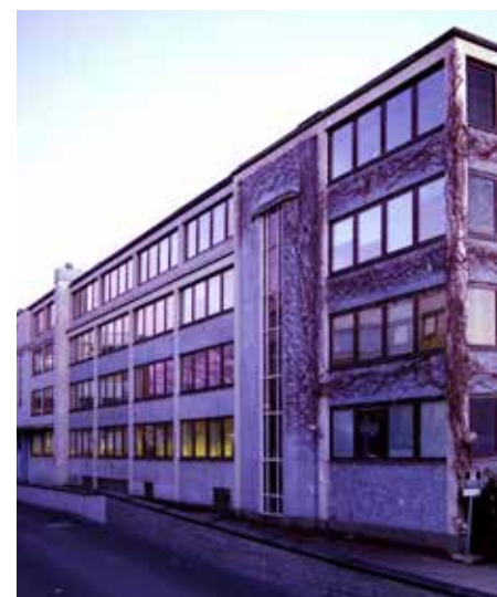
Fabrikken på slutten av sin blå periode, da den var kontorbygg for EDB / Evry.

Lehmkuhl Elektronikk, som ble skilt ut som eget selskap i 1978, omsatte i 1984 for over 200 mill. kroner og hadde over 200 ansatte, og var blant Norges største elektronikselskaper.