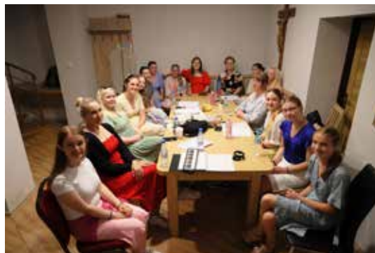
Aspirantkoret i storsalen på Stenbekk.

Kirkeadministrasjonen i Krakow fikk tidlig i 2024