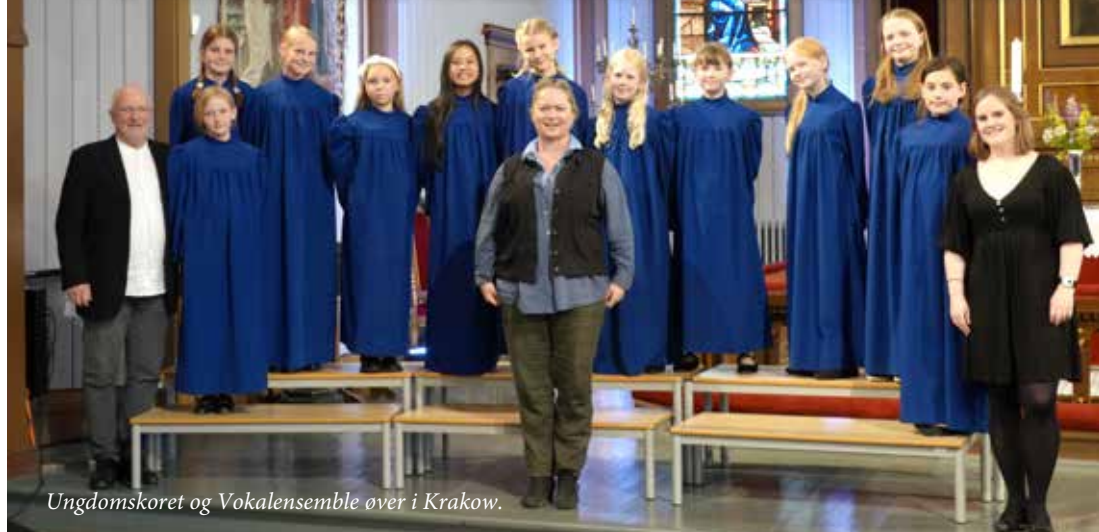
Ungdomskoret og Vokalensemble over i Krakow.