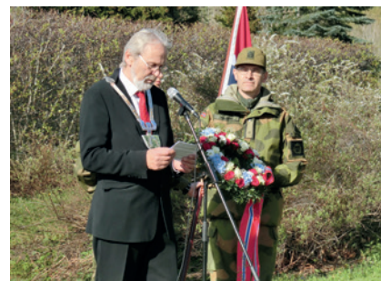
Ordfører og sokneprest 8. mai

Vi minnes for å minne hverandre på: Aldri mer 9. april!