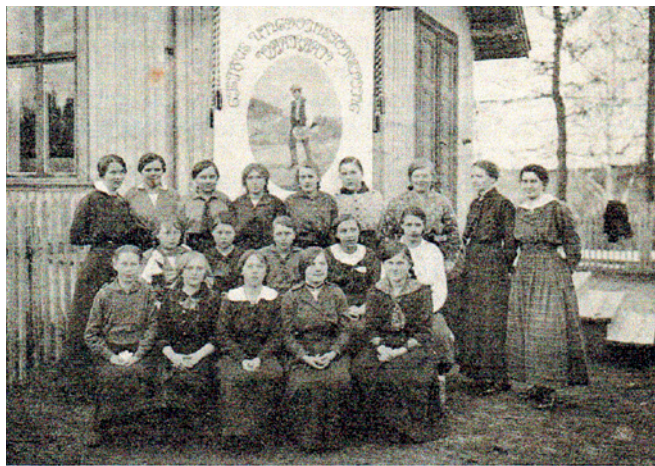
Gjeithus ungdomsforenings pikelag