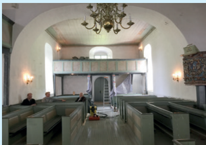
Området som skal sperres