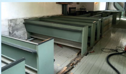
Råte i gulvet