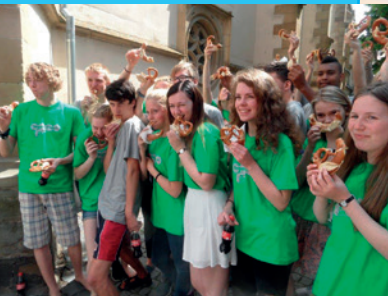
Heggen gospel side 4-5