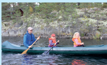
Kano på Sysletjern