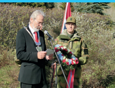
Derfor minnes vi de falne side 25