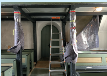
Heggen pakkes inn