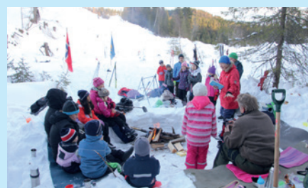
Skidag på Sponevallen