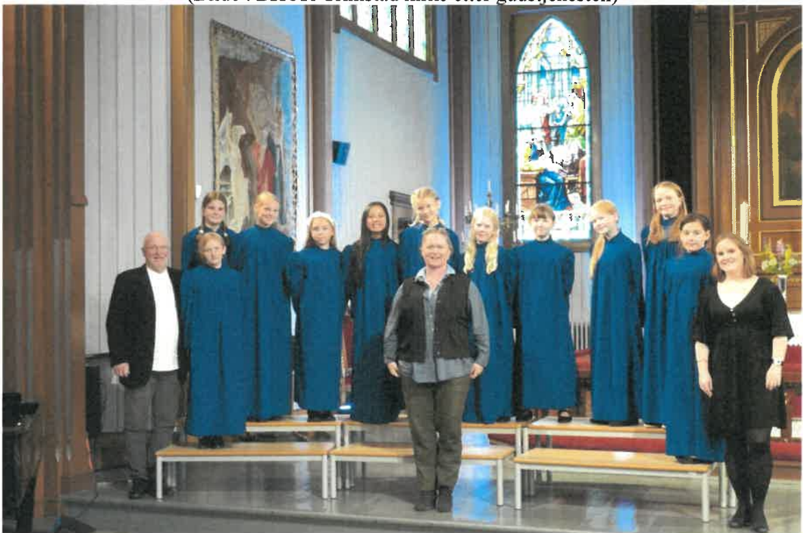
(Bilde : BKOR Grimstad kirke etter gudstjenesten)