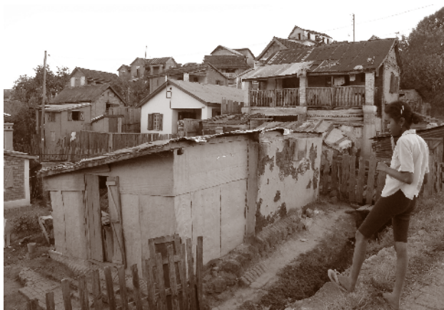
Enkle hus i Antsirabe.