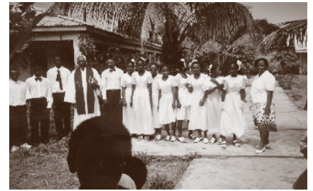
Fra et 50-års konfirmasjonsjubileum.