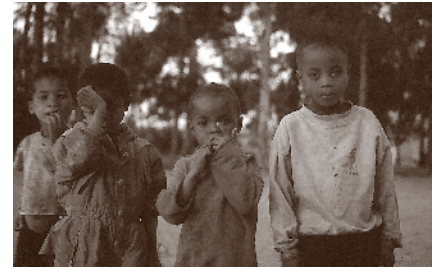
Barn i spedalskbyen Mangarano.