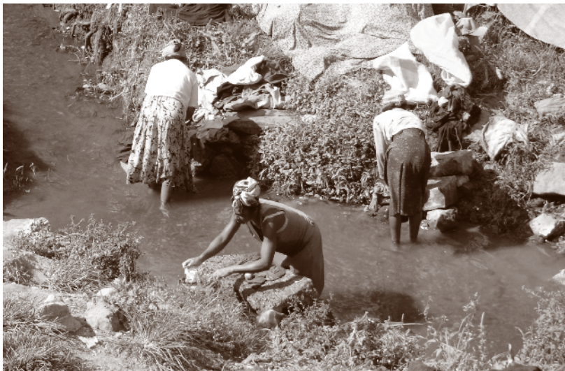
Kvinner som vasker klær midt i byen, Antsirabe.