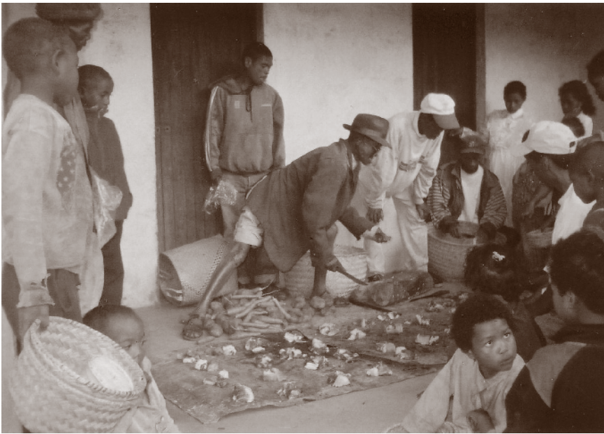
På bildet viser de stolt frem hva gaven ble nyttet til. Dette sier en hel del om prioriteringene i dette landet fjernt fra Norge og vår egen livsstil.