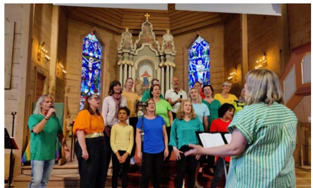
Koret Fonos bidrog på regnbogegudsteneste 22. juni 2023.

Totalt var det 17367 deltakarar på gudstenestene i Os sokn i 2023. Dette talet er høgare enn på over 10 år, og ein gledeleg vekst etter covid-pandemien held fram frå fjoråret. Grafen ovanfor syner korleis pandemi-åra påverka vårt viktigaste samlingspunkt. Vi har i dei påfølgande åra hatt fleire gudstenester enn tidlegare, og snitt-antal deltakarar har ikkje vore høgare sidan 2017. Dette vil vi bygge vidare på!