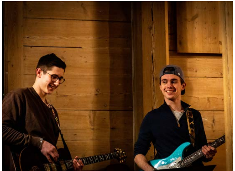
Frå ungdomsgudsteneste i Os kyrkje.

Orgelet i Os kyrkje er 67 år gammalt og viser aldersteikn. Årleg må ein no pårekne ein del utgifter til vedlikehald av dette instrumentet. På sikt må det vere ein ambisjon å få nytt orgel i hovudkyrkja vår. Orgelet i Nore Neset kyrkje er i god stand. Pianoa i Os og Nore Neset kyrkjer og flygelet i storsalen er i god stand, men treng regulering i framtida.