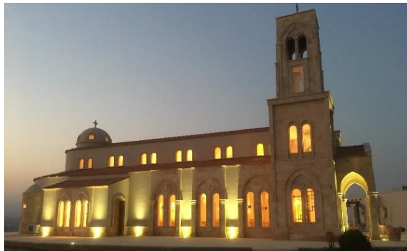
Den lutherske kirken ved Jordanelven