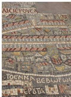
Mosaikken i Madaba