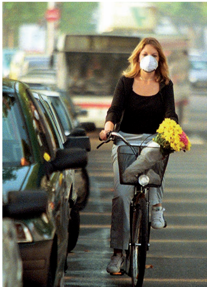
Miljøspørsmåla utfordrar det diakonale arbeidet i kyrkja.

Menneskelivet og menneskeverdet skal vernast frå livet byrjar og til det endar. Kyrkja må derfor vere ei kritisk røyst i høve til dagens abortpraksis, kjempe mot soteringsamfunnet og aktiv dødshjelp, og engasjere seg i dei store etiske problemstillingane som bioteknologien reiser. I tillegg møter diakonien dei konkrete utfordringane frå desse områda på det mellommenneskelege planet. Det finst organisasjonar som arbeider spesielt med dette. Lokalkyrkjelyden kan arbeide med desse emna gjennom etisk refleksjon, sjelesorg og praktiske omsorgsoppgåver, til dømes ordningar med barnevakt og støttekontakt.