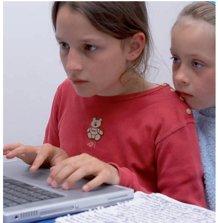
Mobbing av born og unge skjer òg via Internett.

Å kjempe mot vald inneber òg å arbeide med haldningar. Det må drivast førebyggjande arbeid, blant anna ved aktivt å fremje alkoholfrie soner. Her kan det liggje til rette for lokalt samarbeid med politi, skule, uteseksjon, barnevern og familievern, bymisjon og andre organisasjonar.