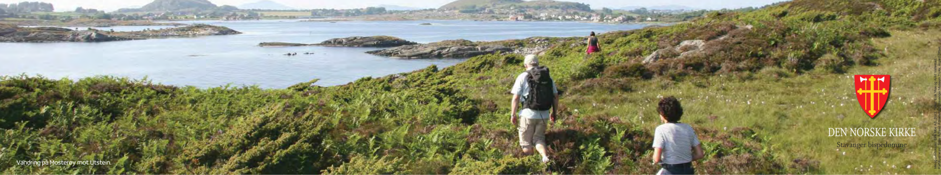
Vandring på Mosterøy mot Utstein.

Søkende mennesker, etablerte kristne og andre som er opptatt av refleksjon rundt egne livsfaser, valg og verdier, legger ut på vandring.