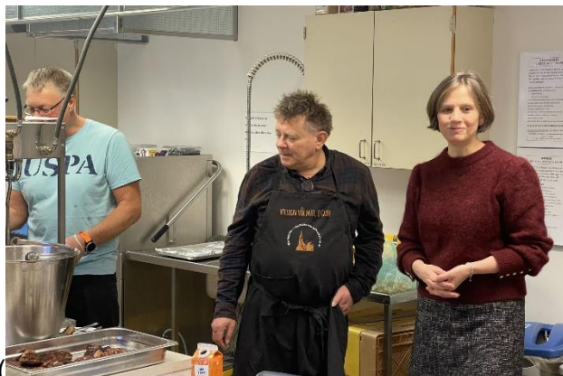
Bilde av statsråd Kjersti Toppe på besøk i Haugesund.

«Mat onna bronå» er et tilbud til de mest sårbare innen rus og psykiatri i Haugesund. Mat som blir laget på kjøkkenet i menighetshuset blir delt ut sammen med klær og gaver. Det meste av maten kommer fra butikker og bakere. Tiltaket drives av en egen organisasjon, men menigheten bidrar med lokaler og folk.