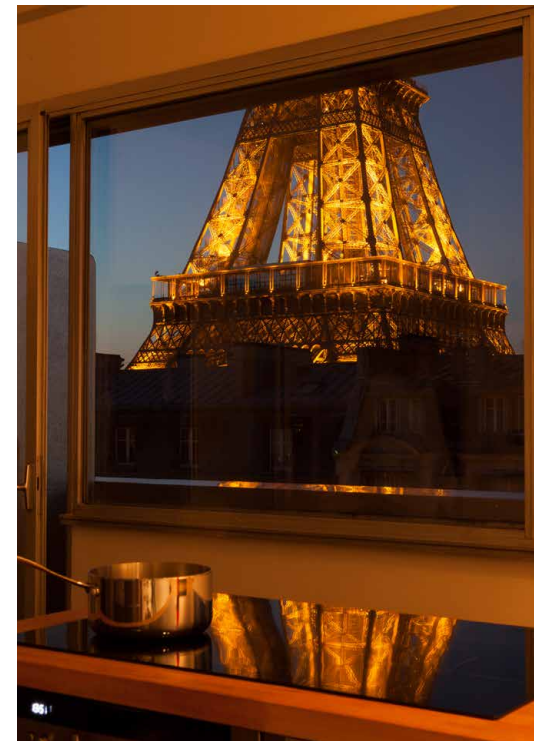
The Eiffel Tower from an apartment in avenue de Suffren, Paris 15e , 2013. C-Print in plexi-mount 165 x 120 cm