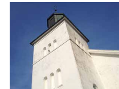
Botne kirke er en nyrestaurert steinkirke fra 1200-tallet viet St Nicolaus.

Botne kirke kl 16.30: Folkefest for hele familien på kirkebakken Utstillingsåpning kl 18. Kunstnersamtale. Beverting og kulturinnslag. Fri entré.