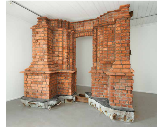
Extraction of the stone madness (detail) , 2014