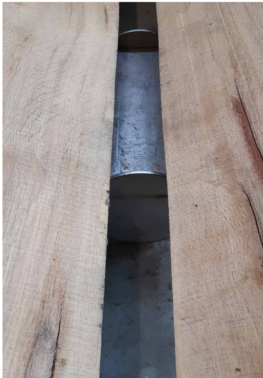
Tree trunks grow and spread IV, detalj