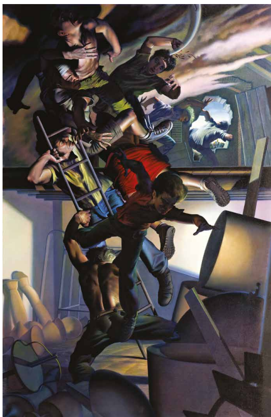
The stairway to heaven, 2003