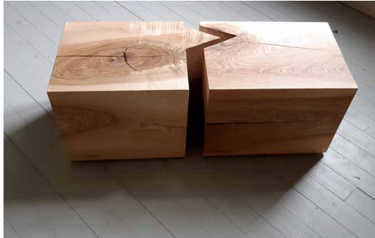
Tree trunks grow and spread III