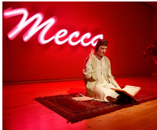
Son of Abdullah , 2007 Silicon and resin life-size sculpture of the artist, donkey and neon sign, dimensions variable.