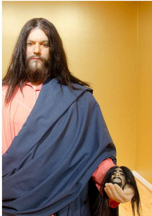
Opposite Imago Dei , 2006 Silicon and resin life-size sculpture of the artist, human skull and shrunken head, dimensions variable.