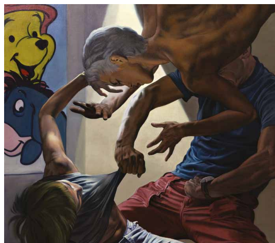
The Deep Religiosity of Capitalism, 2003 (utsnitt).