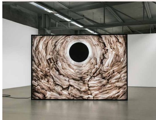
Event Horizon 2011 . 190 x 270 cm. Oil on mylar mounted on the lightbox