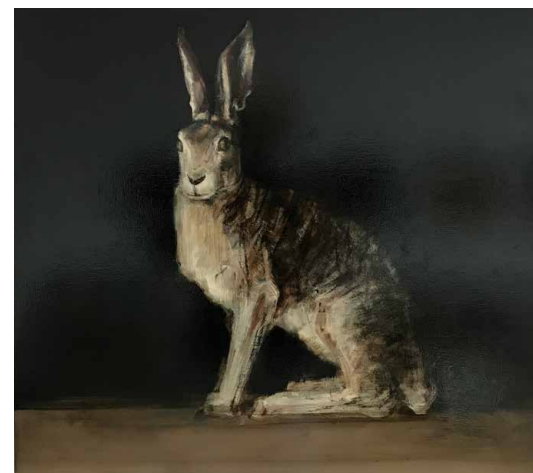
Accademia della Morte 1, 2005 Haren