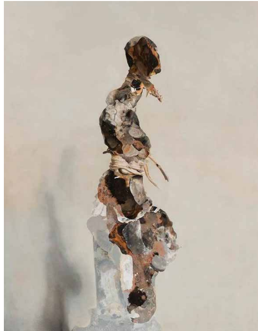
Vestizione del trofeo , 2019. Olje på aluminium. 200 x 150 cm

Nicola Samori (1977) lever og bor i Bagnacavallo utenfor Ravenna i Italia. Bildene utfordrer ofte betrakteren ved å være malt i en klassisk renessansestil, men hvor motivene trues av å løse seg opp samtidig som de henviser til modernismens konsentrasjon om flate og tekstur som vesentlige komponenter. I denne utstillingen åpner Nicola Samori for en samtale om hva den historisk overleverte billedtradisjonen som kirken forvalter kan bety for dagens mennesker.