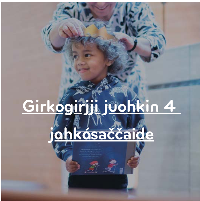
Girkogirjji juohkin 4 johkásaččaide

Girkuin miehtá riikka lágiduvvojit doaimmat mánáide ja nuoraide, gos sii sáhttet oahpásmuvvat risttalaš oskuin. Vuolábealde leat muhtin ovdamearkkat.