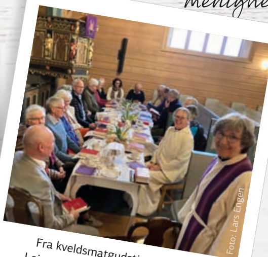
Fra kveldsmatgudstjenesten i Leinstrand kirke på skjærtorsdag