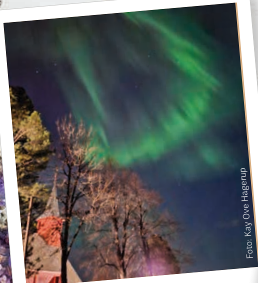
Nordlys over Leinstrand kirke