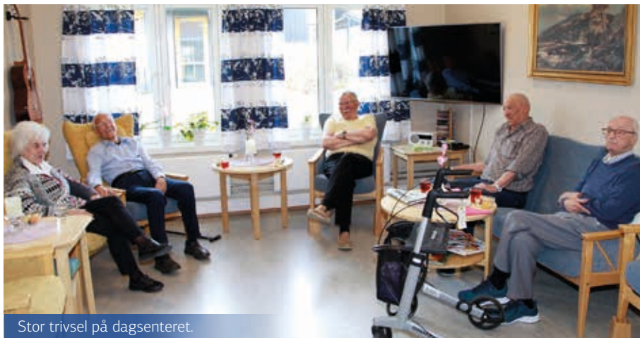
Stor trivsel på dagsenteret.

På Spongdal er det bydelskafe som har åpent alle hverdager fra kl 11.00 til 14.00, første søndag i måneden er det åpent for