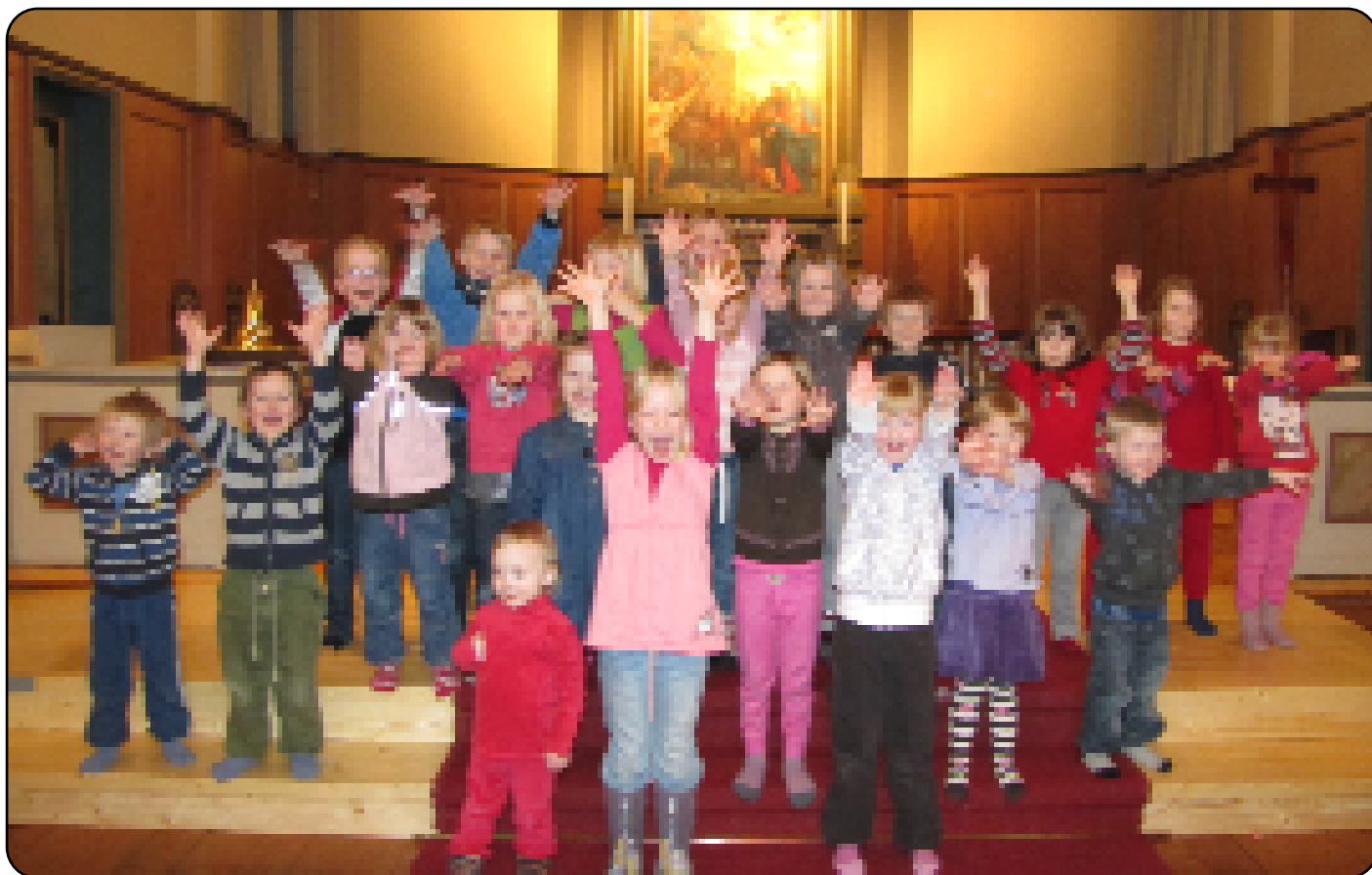
Barnekoret Hummer og Kanari (se s. 5)