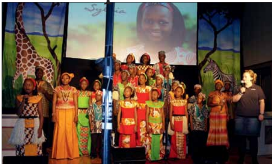
Watoto ga publikum en sterk og flott opplevelse gjennom sine sanger og fortellinger.

27. september var det konsert i samfunns- huset på Stokkøya. Stemningen var stor da dansende og syngende barn entret scenen akkompagnert av afrikanske trommer. En time og 20 minutter går fort når vi får være med på en reise til Uganda gjennom sang, dans, musikk og sterke historier om livet til foreldreløse barn. For hvert enkelt av barna som var med i koret har opplevd å bli forlatt på grunn av sykdom, krig eller fattigdom. Men gjennom arbeidet som Watoto har i tre barnelandsbyer i Uganda, har de fått et nytt liv og håp for fremtiden. 28. september var det folket i Åfjord som fikk oppleve dette fyrverkeriet av rytmer, farger og moderne gospel. På Åset hadde de to konserter hvor elevene fikk være med både å synge og å danse. På kvelden var det konsert i kirka. Også her ble det mulighet for å synge med og løse litt opp rundt hoftepartiet. Takk til dere som kom