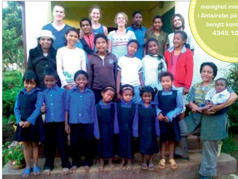
Alle samlet på trappa på barnehjemmet.

Da vi kom var de eldste barna fortsatt på skolen, ungdomsskole eller yrkesskole.