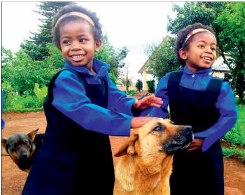
Barna med hunden er fra barnehjemmet, da vi kom inn porten.