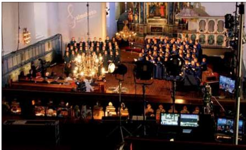
Salmesendingen på NRK fra Vår Frue kirke i Trondheim.