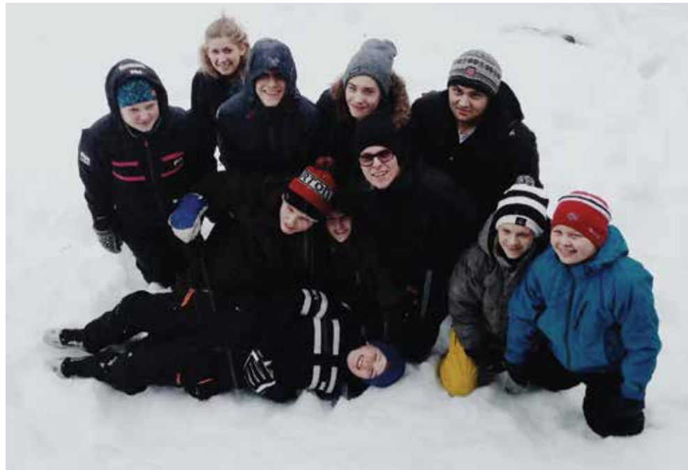
Ni ungdommer fra Åfjord reiser i påskea til Makedonia for å bistå med praktisk arbeid.

Etter et halvt år kom en ny åpning i Makedonia. Vennene våre hadde kommet seg litt, grensa til Makedonia var stengt for flykninger og