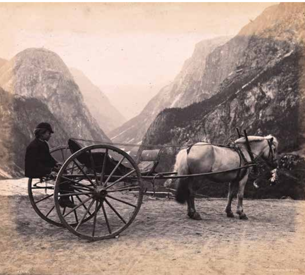
Dette bildet er tatt i Nerøydalen på Vestlandet på slutten av 1800-tallet. Fjordingen trekker karjolen som hadde plass til en eller to passasjerer. De store hjulene var for å få høyest mulig fart.

Dagligliv i Åfjord prestegård tidlig i forrige århundre.