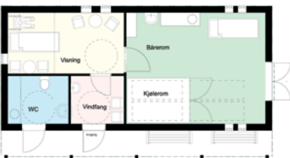
Plantegning av det nye bårhuset.

Øg gravplassarbeider Einar Strøm tilføyer: «For oss som arbeider på kirkegården, er det nå blitt veldig lett vint å flytte kister mellom bårhuset, kirken og gravstedet. Også i en slik bransje er gode HMS-tiltak viktige for de ansatte.»