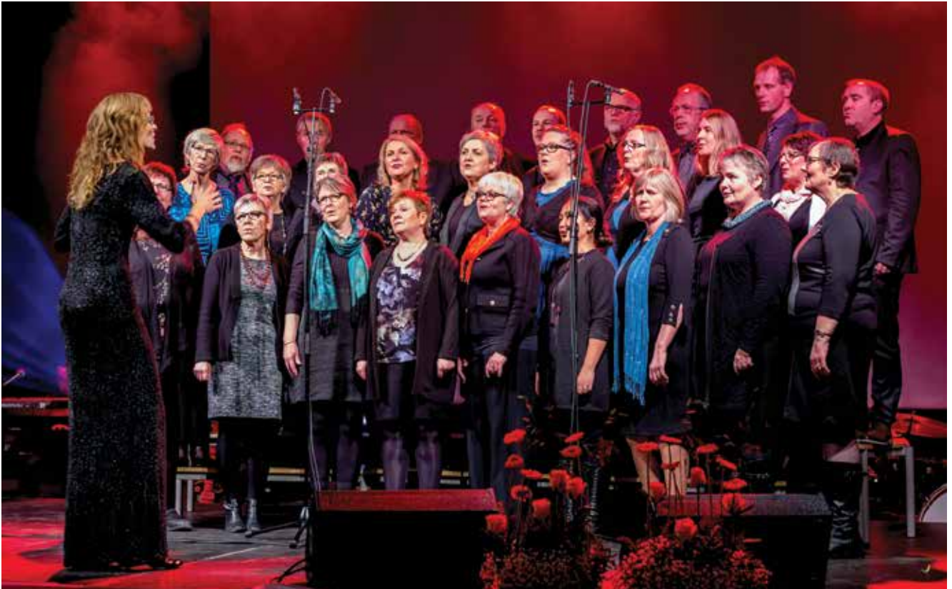
Musikkoret Håp på scenen under Åfjordprisen i februar i år.