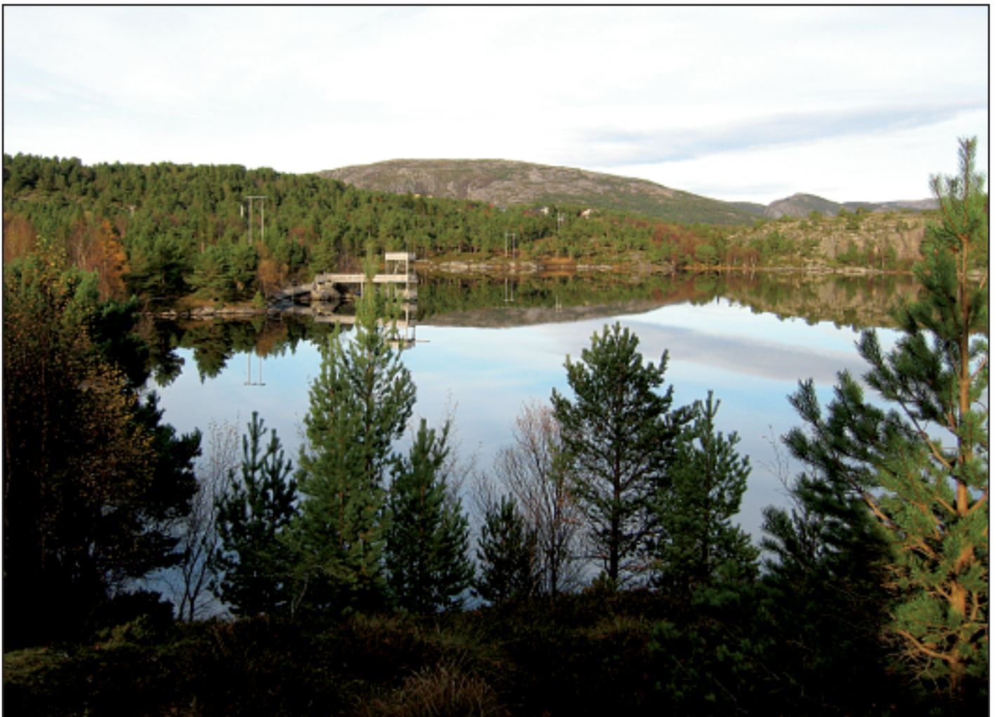
Oktoberstemning ved Herfjordvatnet