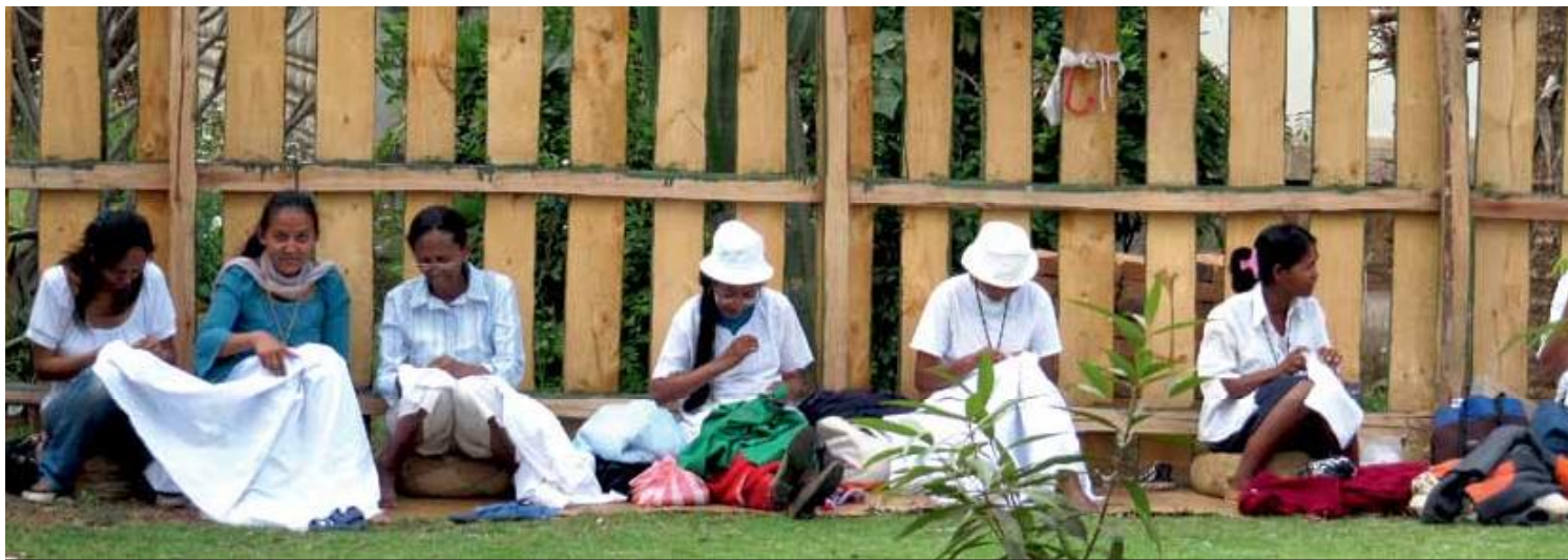
Dyktige syersker på Madagaskar jobber under enkle forhold.