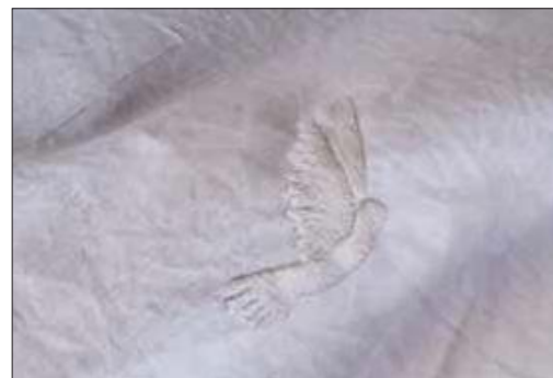
En due blir brodert på hver dåpsklut.

Dåpsklutene somer tatt i bruk i Stoksund og Åfjord har reist langt, helt fra Madagaskar. Men ved å kjøpe produktene bidrar vi med jobb, mat og undervisning.