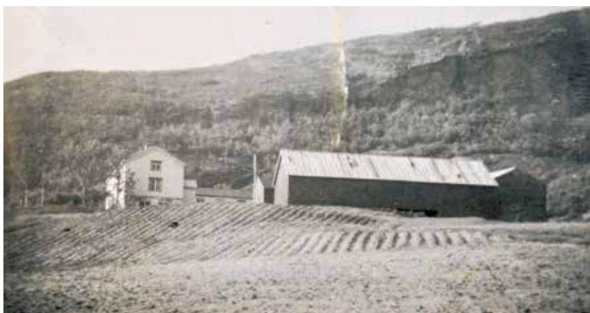
Kapellangården i Roan. Bildet viser våningshus, mastu, stabbur, fjøs til de forskjellige dyra. Bygningen helt til høyre hadde fire forskjellige funksjoner, høvlåve, båtbyggerverksted og snekkerbu.