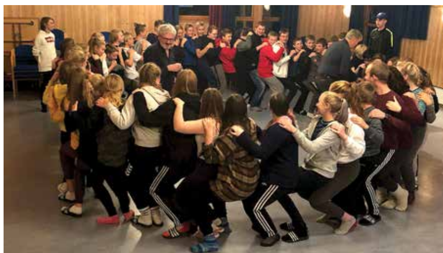
Det er ingenting å utsette på innsatsen når cirka 60 konfirmanter er samlet på leir på Mjuklia.