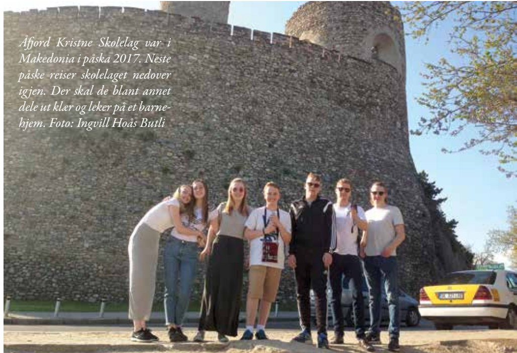
Åfjord Kristne Skolelag var i Makedonia i påske 2017. Neste påske reiser skolelaget nedover igjen. Der skal de blant annet dele ut klær og leker på et barnehjem.

Er dette noe du vil være med å støtte? Overfør til skolelagets konto: 4345 45