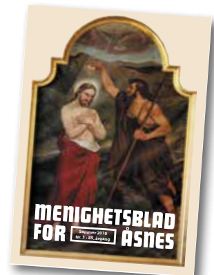
Alterbilde Gjesåsen kirke foto: Else Hanna Tendø.

Adressen til Åsnes kirkelige fellesråd sin nettside er: www.kirken.no/asnes