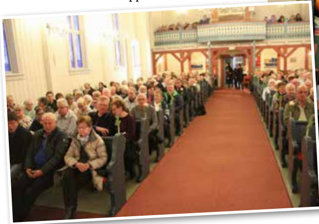
Begeistrede tilhørere fylte Gjesåsen kirke.