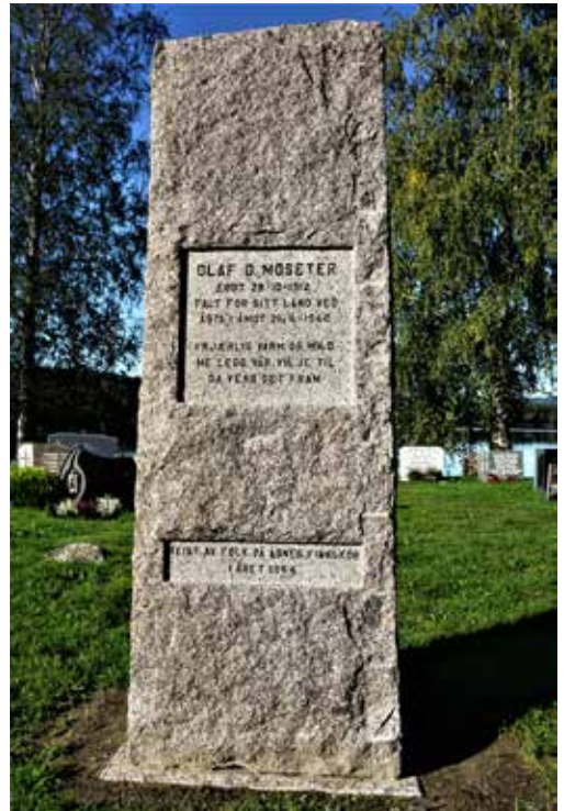
Olaf O. Moseters minnestein, slik den framstår nå.

REIST AV FOLK PÅ ÅSNES FINNSKOG I ÅRET 1944