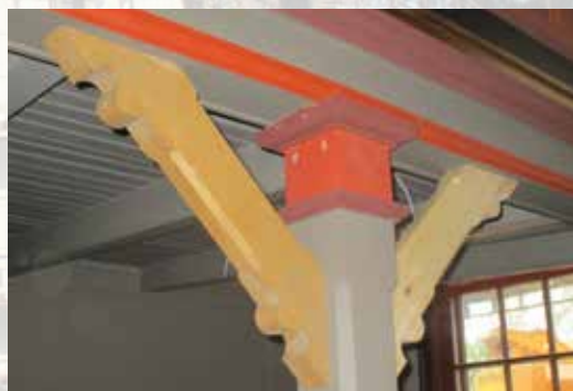
Utsmykning av søylene ved inngangen til skipene ble funnet igjen på loftet, og har nå kommet tilbake på plass.