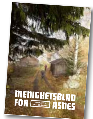
Høst i Gardsknappen.