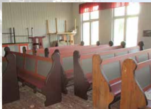
Benkene ble flyttet over i skolen og malt der