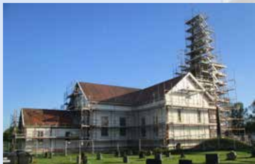
Kledd i stillas for utvendig maling.