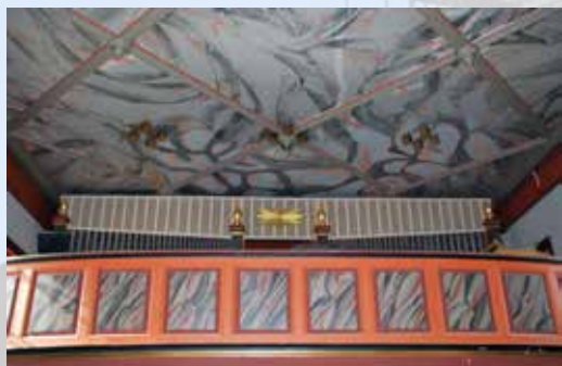
Orgelgalleriet og taket er frisket opp, og veggtepetene er strammet opp og malt.