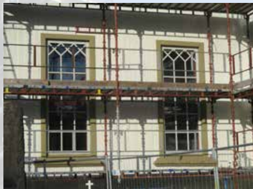
Vinduskarmene er tilbake i opprinnelig farge.