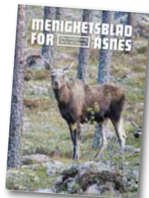
Skogens konge

Åsnes kirkelige fellesråd: www.kirken.no/asnes