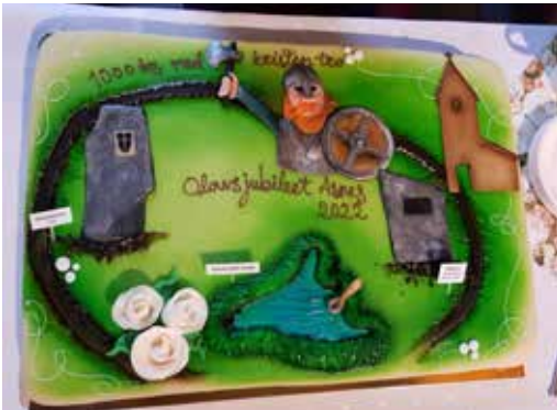
Jubileumskaken – bakt av Ivar The Cakemaker.