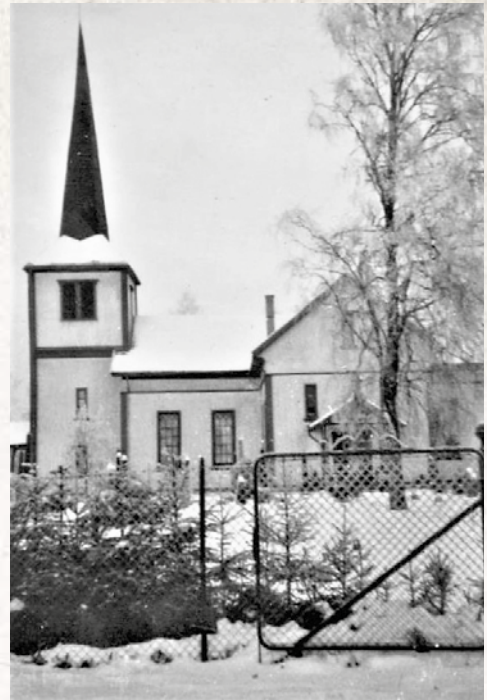
Gammelt vinterbilde av Åsnes kirke. Tilhører Solveig Sæta.