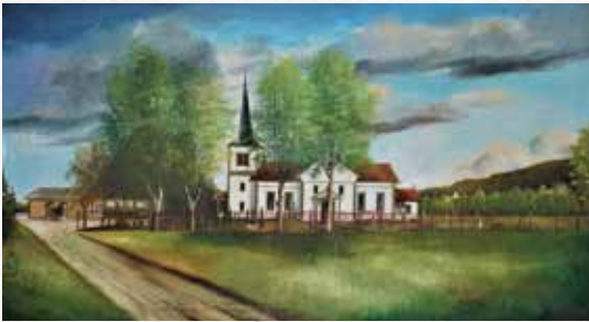
Åsnes kirke, maleri av Lindblom. Tilhører Solveig Sæta.

Kilder: Folketellingslister, kirkebøker, gamle menighetsblad og muntlige overleveringer.